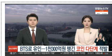
불법 다단계 수사 관련 방송 보도