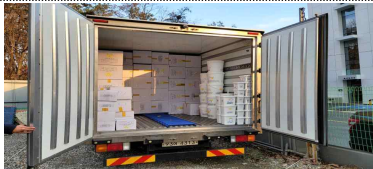
사설주차장에 밤샘 보관