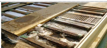
결빙을 핑계로 세륜기 미가동