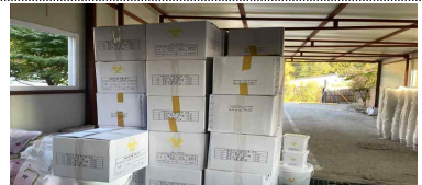
부실 보관창고 운영