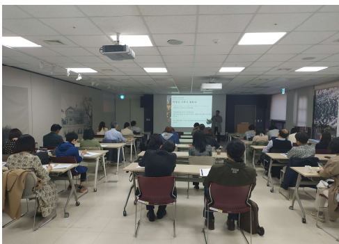
1 학습실 교육실 운영 현황