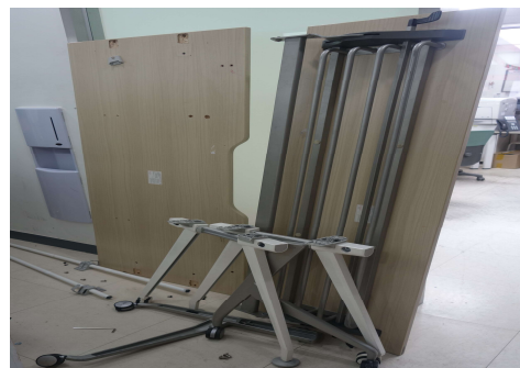
1학습실 탁자 파손 현황