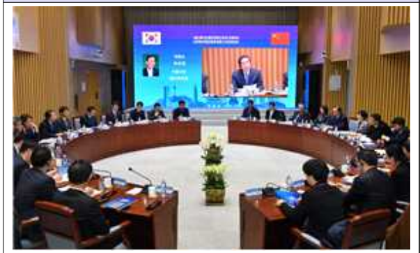
서울-베이징 통합위원회 제3차 전체회의(2)