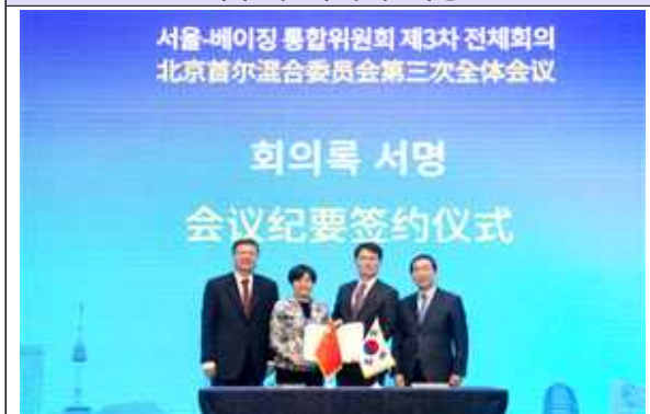
사무국 회의록 서명