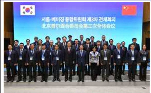
서울-베이징 통합위원회 제3차 전체회의(1)