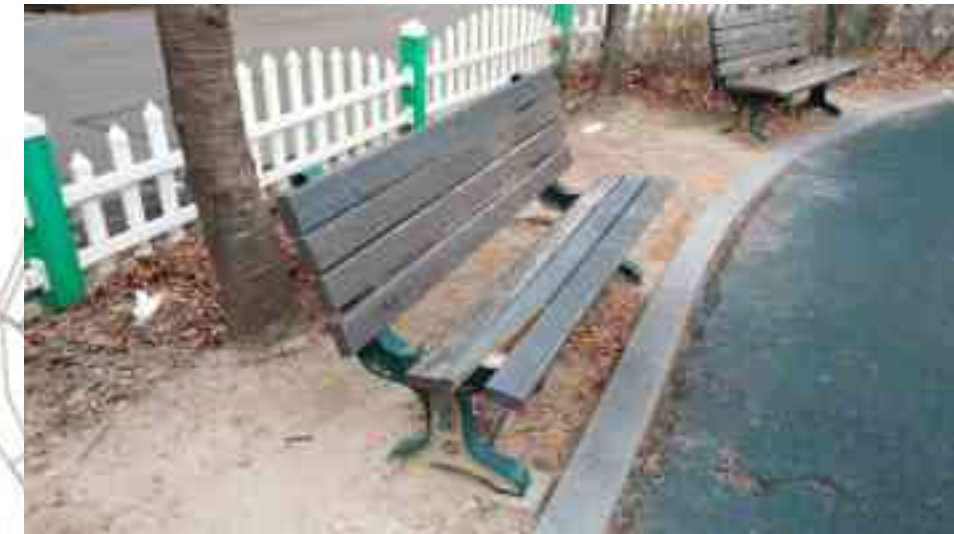
등의자 교체 - 2개소