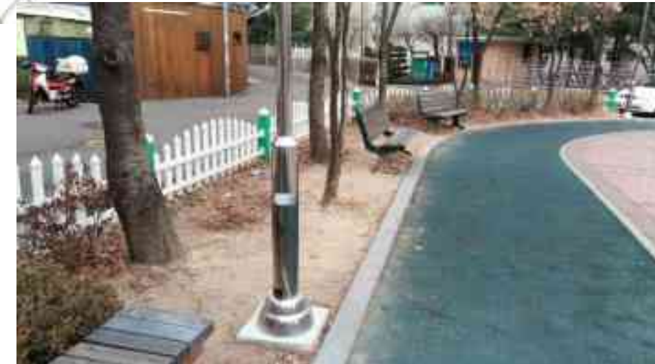
수목 나지 상태 → 수목식재(남천)