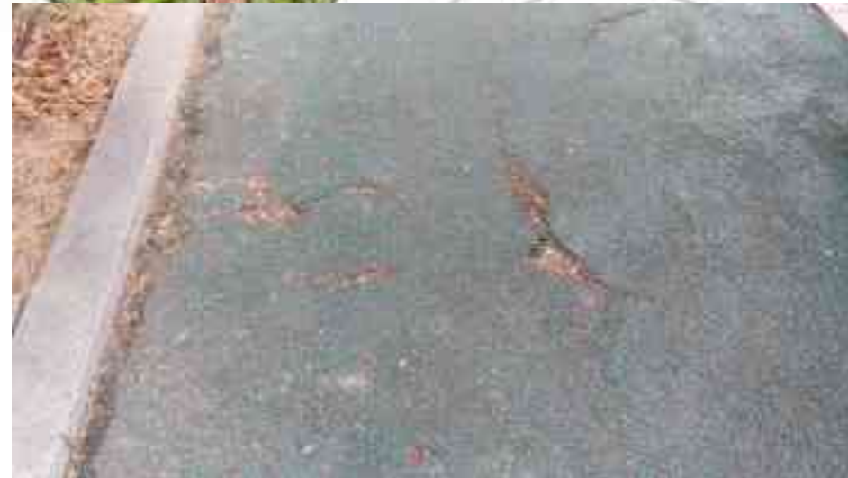
산책로 고무칩포장 철거 → 코르크포장 195m 2