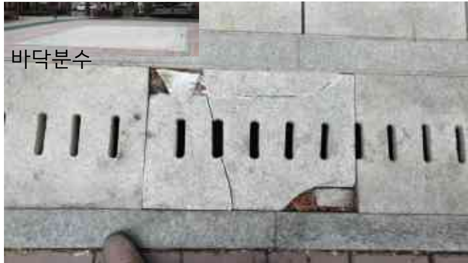
바닥분수 화강석 트렌치 교체 - 4ea