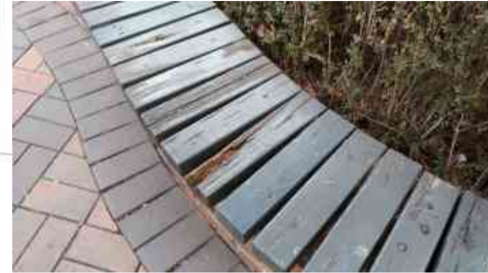
연식의자 목재상판 교체 - 12ea