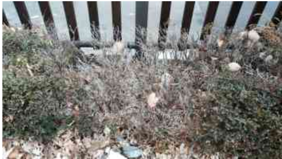
회양목 고사(100주) → 회양목식재