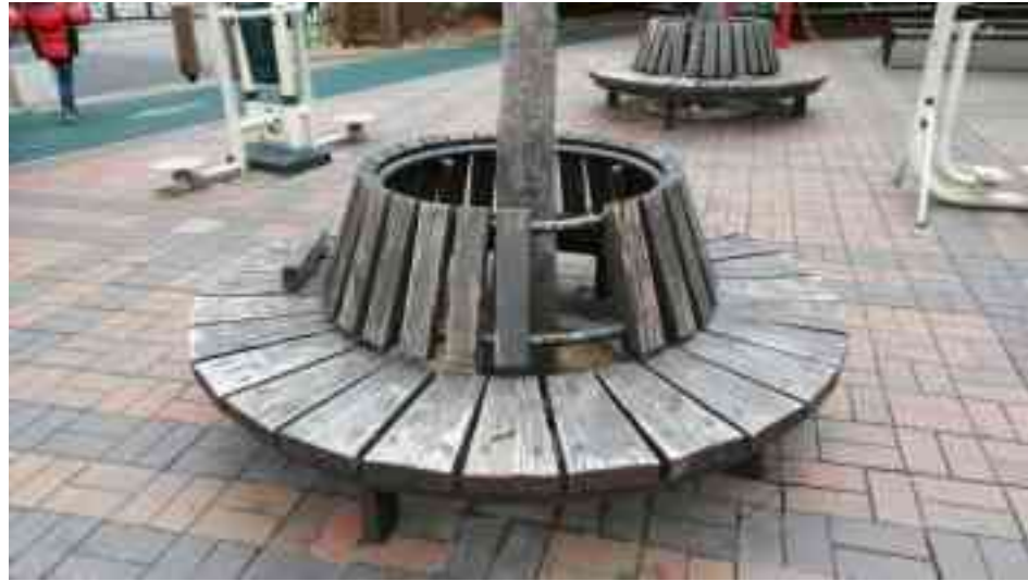
원형의자 교체 - 4개소