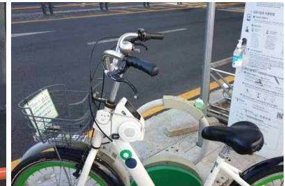
따릉이 손 소독제 비치