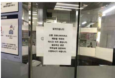
지하철 마스크 관련 안내