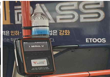
버스 손 소독제 비치