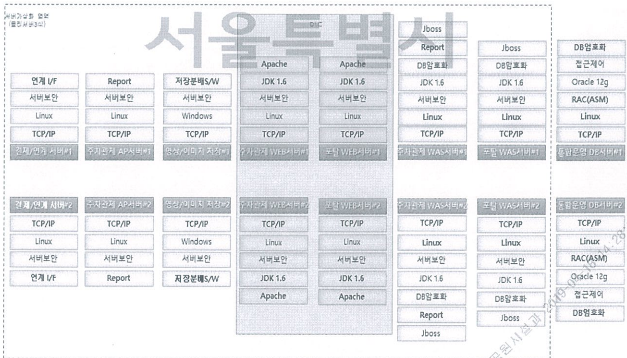
그림 2 소프트웨어 구성도