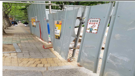
5월 지적사항(고덕)- 공사장 출입문 정비필요(외부인 출입가능)