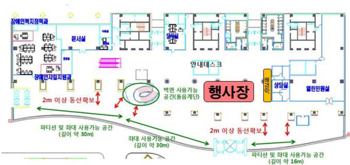
1층 로비 평면도