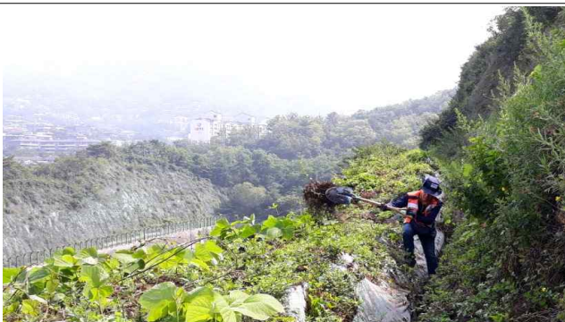
사진설명(비탈면 배수로 청소)