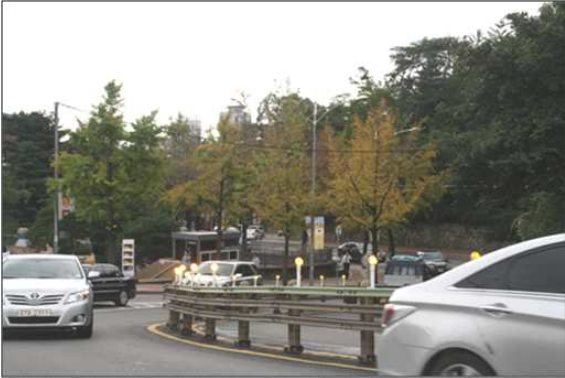
황화현상 가로수(유공관 설치)