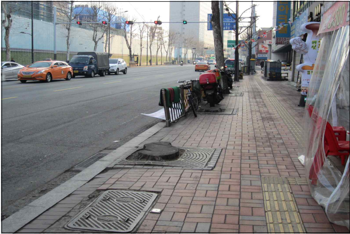
가로수 결주 보식