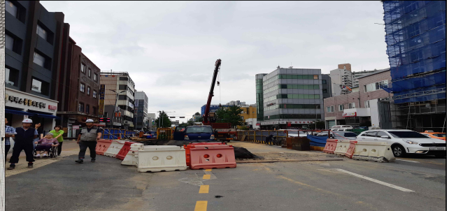
시점부 작업장(서연빌딩 앞) 배면부를 도로로 이용토록 계획