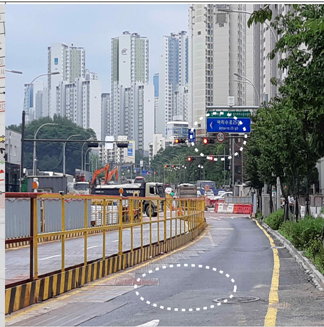
정거장 구간 민원해소를 위하여 최고속도제한 (50→40)을 변경조치(8차 자문회의)