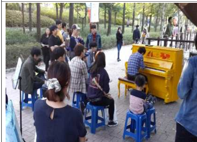
시민 자율연주 _선유도공원