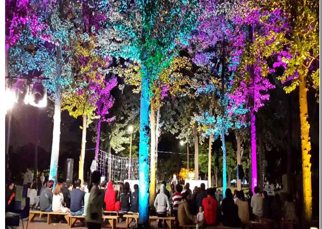
달빛 피크닉 _ 선유도공원 숲마당