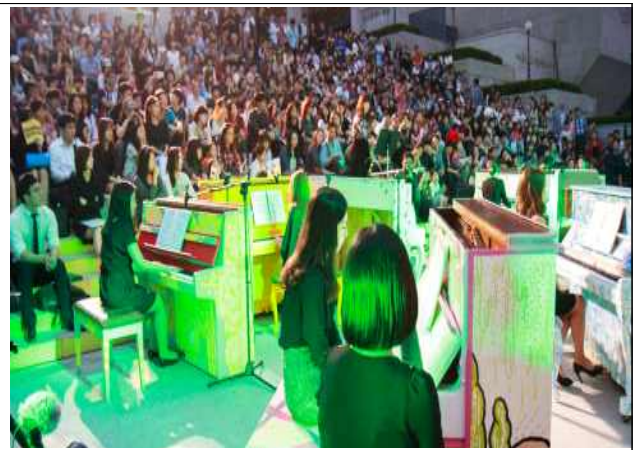
10대를 위한 피아노 합주_세종문화회관