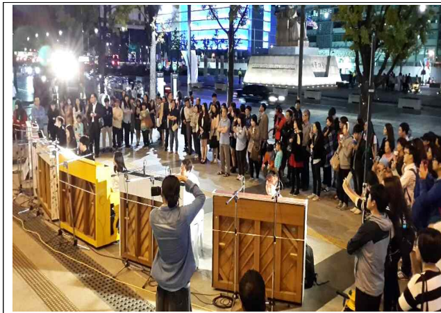
6대를 위한 피아노 연주 _ 세종문화회관 앞