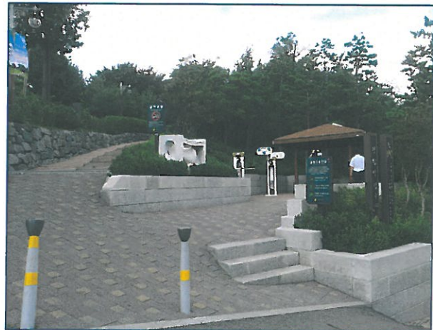
대 상 지 현 황