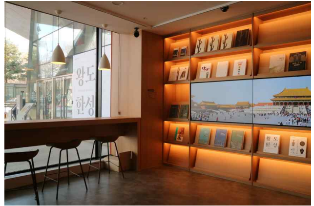
영상물 상영 공간