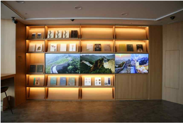
영상물 상영 공간