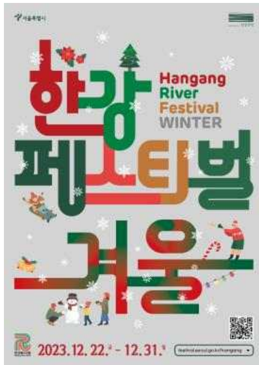
2023 한강페스티벌_겨울 포스터