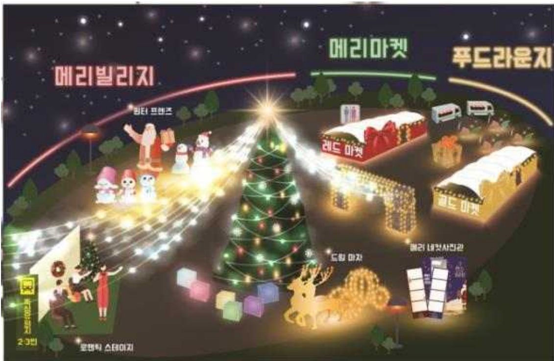
2023 로맨틱 한강 크리스마스 마켓 행사 조감도