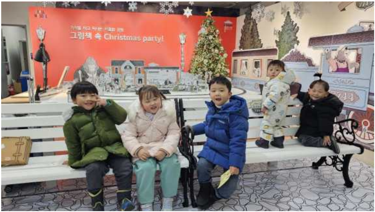
산타마을 기차역 포토존