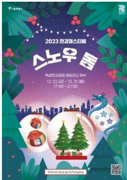
2023 한강페스티벌_ 스노우 돔 포스터