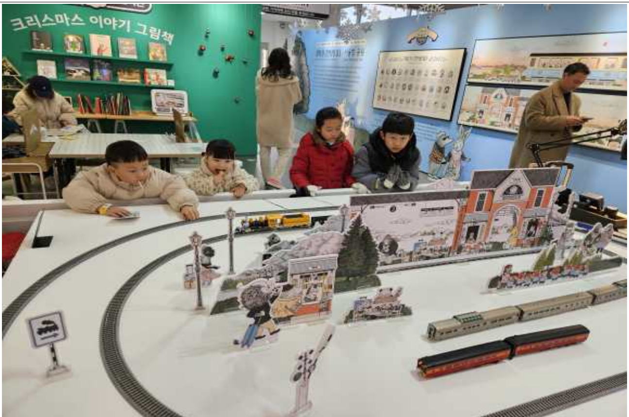
증기기관차 디오라마 관람