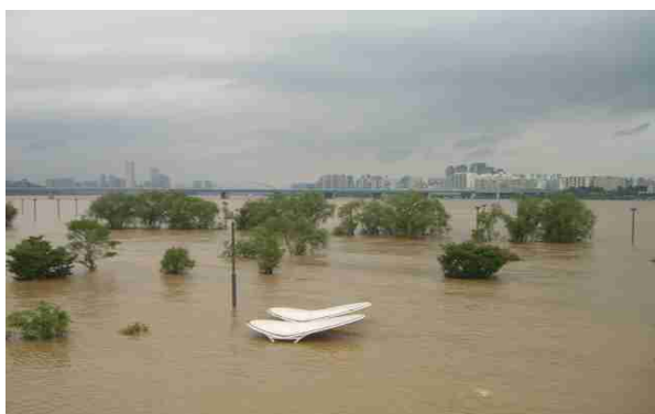
<반포한강공원 서래섬 부근('11.7.28 14시)>