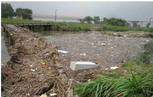
<난지한강공원 생태습지원(11.07.29 11시)>