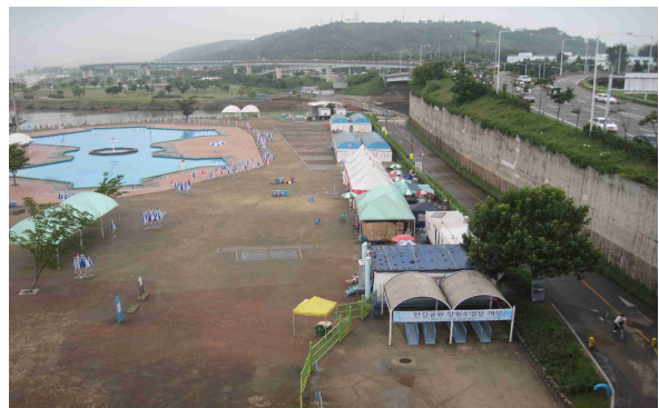
<망원한강공원 수영장 ('11.8.3 14시)>