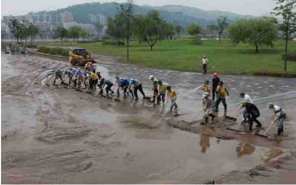
<광나루한강공원 (본부 직원)>