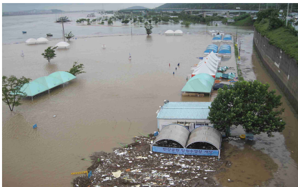
<망원한강공원 수영장 ('11.7.28 14시)>

· 독섬 49,496명, 여의도 28,847명, 잠실 11,979명, 잠원 9,467명, 광나루 6,205명, 망원 13,756명, 난지 6,794명