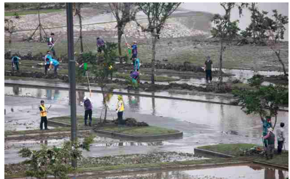
<반포한강공원 수해복구활동 (자원봉사)>