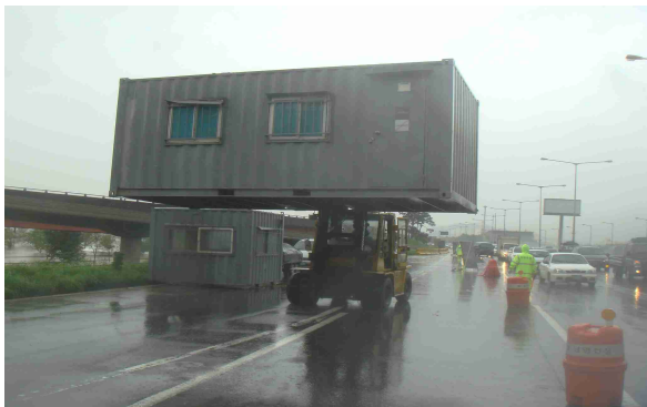
<시설물 대피중 (11.7.27)>