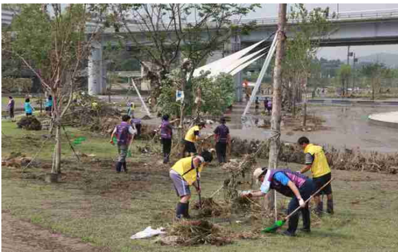
<반포한강공원 수해복구활동 (자원봉사)>