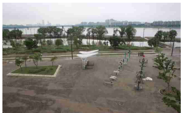
<반포한강공원 서래섬 부근('11.8.1 15시)>