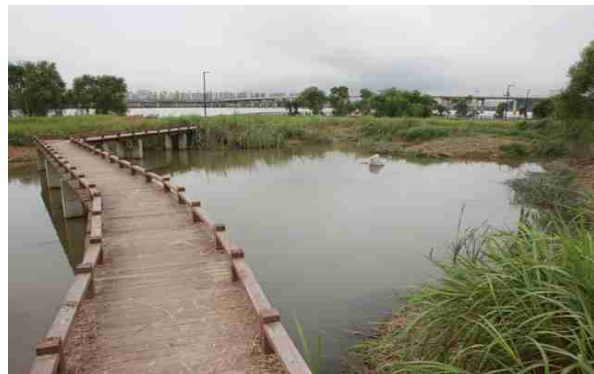
<난지한강공원 생태습지원(11.08.02 11시)>