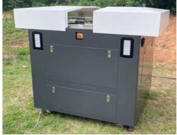
고성능 드론 및 드론스테이션