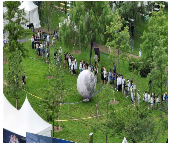
2022 난지한강공원(젊음의 광장) 행사