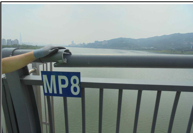
사진 4 : 난간 이탈(MP3, MP5, MP8 등 )