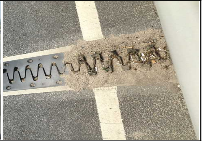
사진 6 : 신축이음 토사 퇴적(MP12)