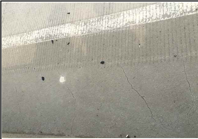
사진 1 : LMC 포장 균열(RAMP-B, C, A, F)