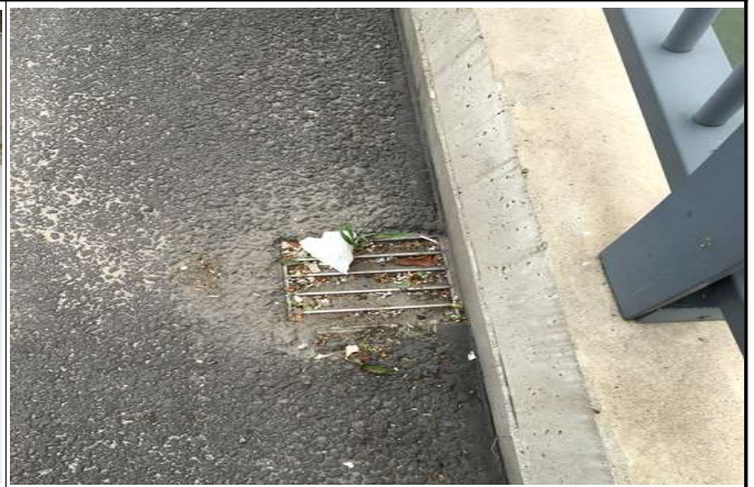
사진 3 : 배수관 토사 및 이물질 퇴적 (MP6, MP7, MP12)