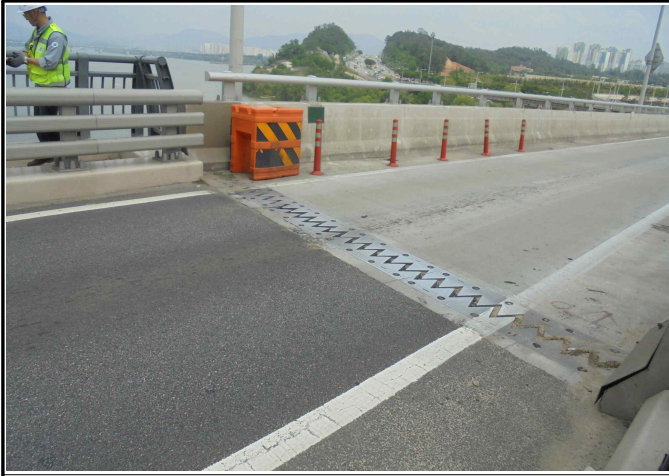
사진 5 : 신축이음 파손(MP3, MP10, FA2)