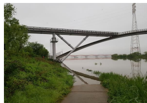
선유교 하부 (5.18)