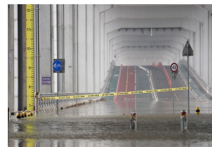
잠수교 침수 (5.18))