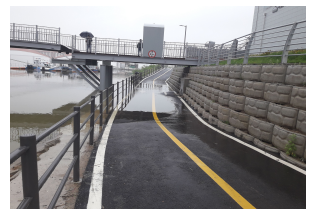
망원 함상공원 앞 (5.18)