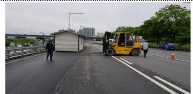
반포공원 시설물 대피 (전, 중, 후)