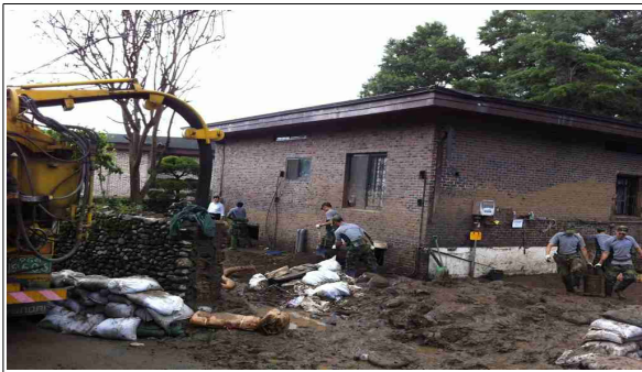
준설차 지하실 토사 제거작업(형촌마을)