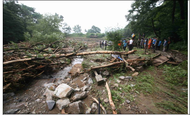
우면산 생태공원 피해