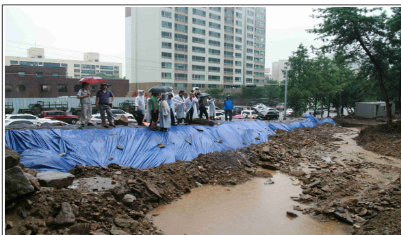
산사태 현장 합동조사(래미안 APT 앞)