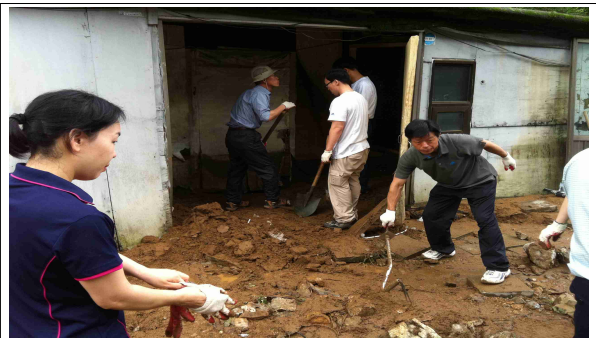
우면산 비닐하우스 구호활동(전원마을)