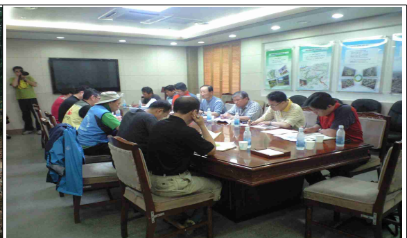
산사태 복구방안 자문회의(8.2)