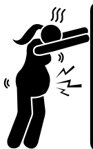
규칙적인 진통 (초산 2분 이하/경산 5분 이하)