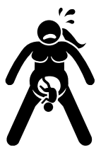
태아 일부 보임