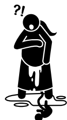
이미 분만된 상태