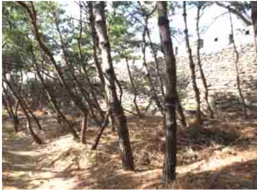
① 소나무림 구간(300m) 기존 산책로 활용