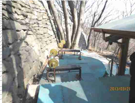
③ 남산체육회 후면(50m)