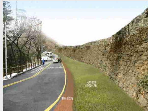
- 2009 서울성곽 중장기 종합정비 기본계획 (165구간 황토길 조성 전후 이미지)