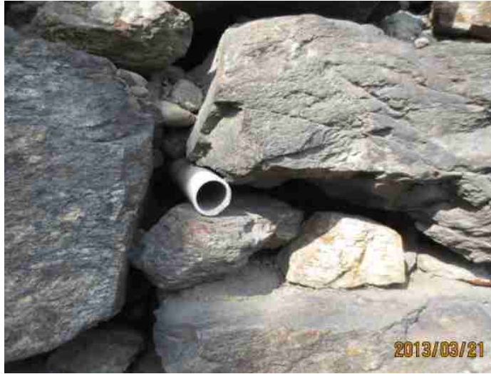
PVC파이프 돌출부 절단 석재은폐