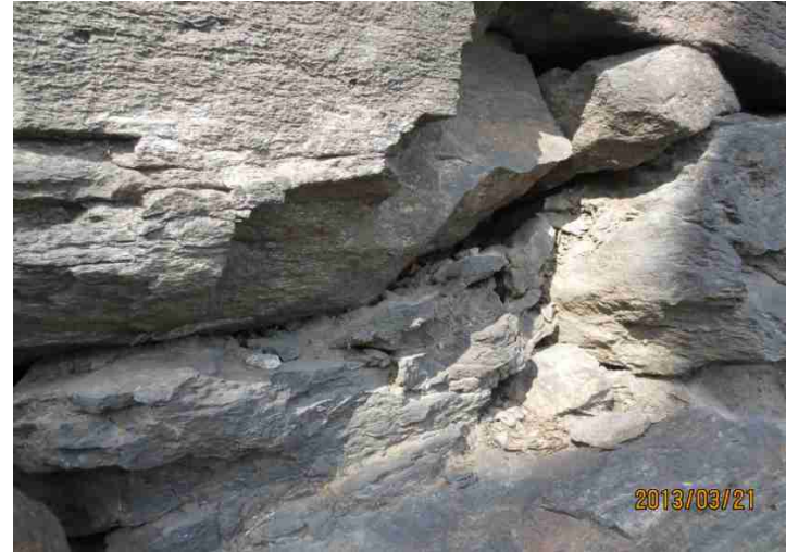
시멘트 노출부 제거 및 강회보수