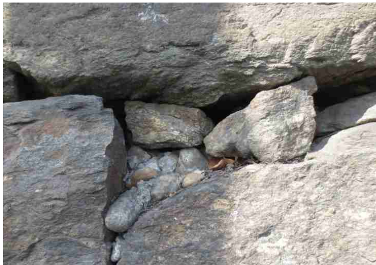
콘크리트 노출부 제거 및 석재은폐