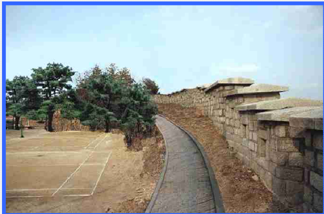
단절구간 정비, 연결 (100m)