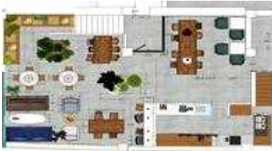
공유형상점(녹원) 컨셉디자인(주거환경학과 협조)