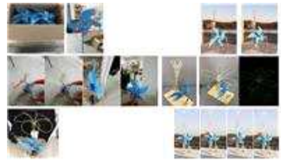
< 키네틱아트** 공작소 운영 >

*캡스톤디자인(창의적 종합설계):문제를 해결할 능력을 키우기 위해 작품을 기획하거나 설계, 제작을 논문대신으로 하는 교육과정