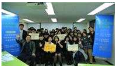
소셜 크라우드펀딩 경진대회

▶ 성공회대 : 사회적경제 창업교육, 다문화 중도입국 청소년 자립 지원 프로그램 개발 - 창업교육, 창업캠프, 멘토링/ 다문화 주민의 교류증진/ 청소년 진로탐색 지원