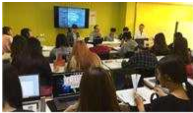
< 캡스톤디자인* 수업 진행 >

▶ 숙대 : 학생+상인의 협력을 통한 용문전통시장 상권 활성화, 청년창업 일자리 창출 - 정규교과의 캡스톤디자인* 프로젝트/ 학생공모전/ 용산창작소 프로그램 운영