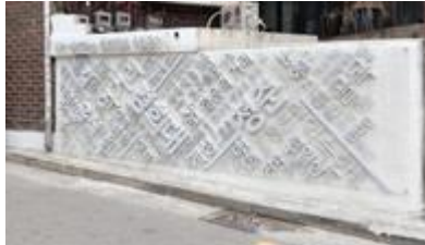
숨,프로젝트 노후화된 벽면 개선 작업