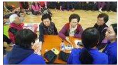
재학생 재능나눔 사업