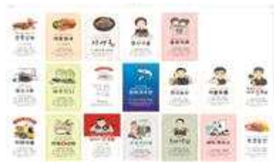
< 용문전통시장 상인 명함제작 >