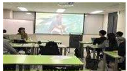
촬영된 다큐멘터리 상영과 평가

▶ 한성대 : 청년예술인 추가 모집(5명), 성곽길 예술활동, 역사문화 해설사 양성 - 위치/규모 : 성북구 삼선동 302외 3 / 2개동 10실, 연면적 678m 2 - 예술가 레지던시 운영/ 성곽길 창작·전시/ 해설사 활동/ 청년 창업가 창업활동 지원