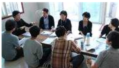
청년 예술작가 아이디어 회의

▶ 한성대 : 청년예술인 추가 모집(5명), 성곽길 예술활동, 역사문화 해설사 양성 - 위치/규모 : 성북구 삼선동 302외 3 / 2개동 10실, 연면적 678m 2 - 예술가 레지던시 운영/ 성곽길 창작·전시/ 해설사 활동/ 청년 창업가 창업활동 지원