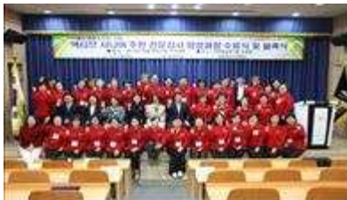
액티브 시니어 주민 전문강사단 발족