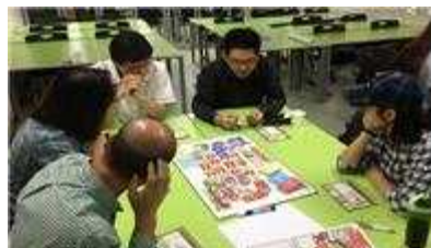
창업 기초반 수업 현장