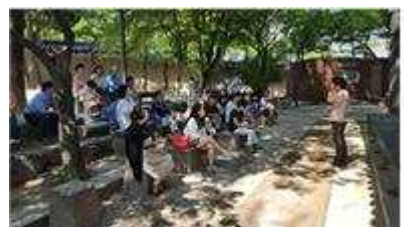
해설사 & 도슨트 야외 수업