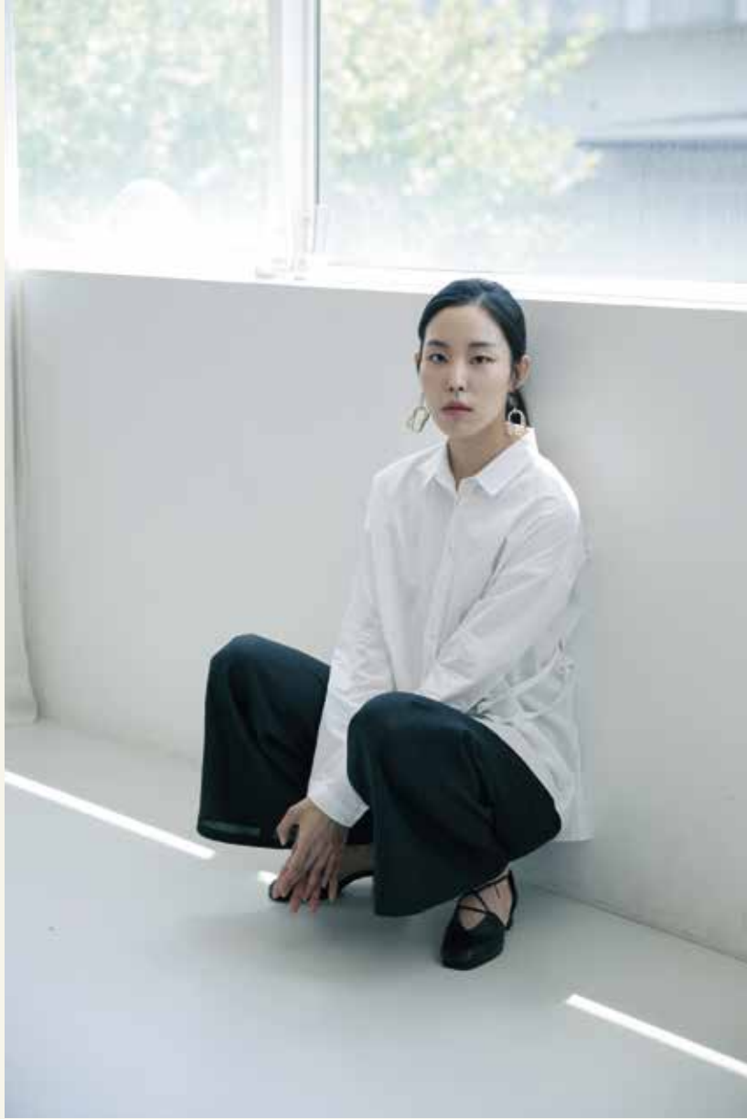
셔츠 [19SSR07001], 팬츠 [19SPN07002] | Designer 박채원