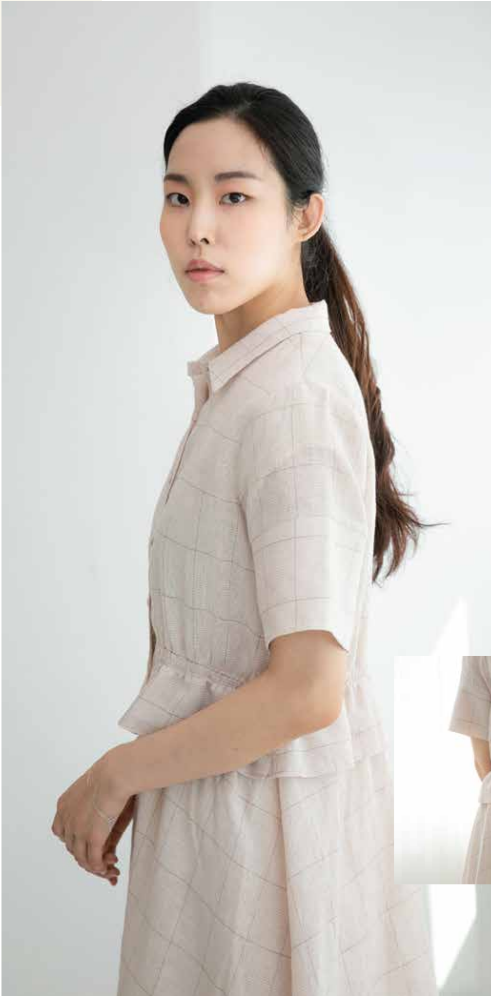
원피스 [19SOP03003] | Designer 조민선