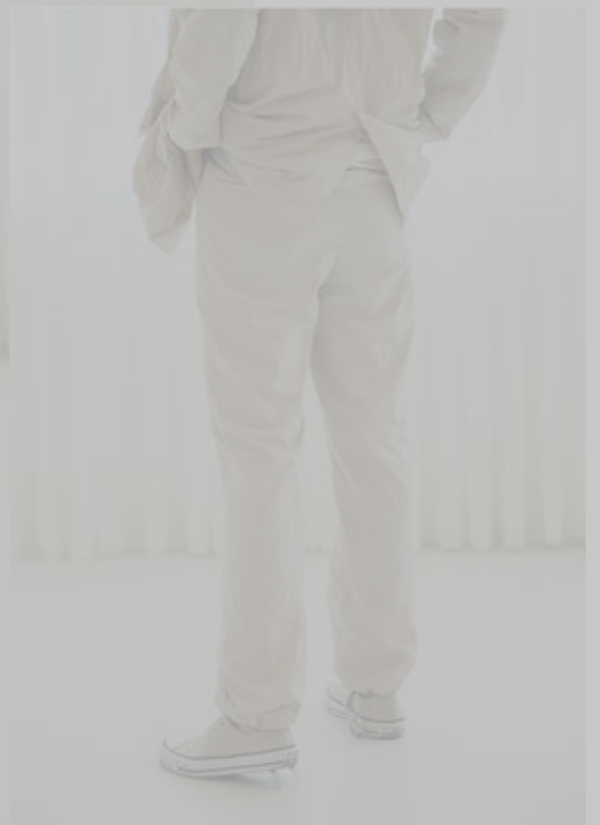
자켓 [19SJK08001], 팬츠 [19SPN08003] | Designer 정거함