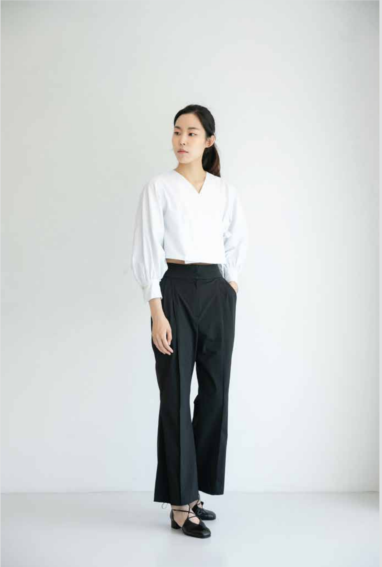
블라우스 [19SBL09003] | Designer 감미선 팬츠 [19SPN10002] | Designer 한지원