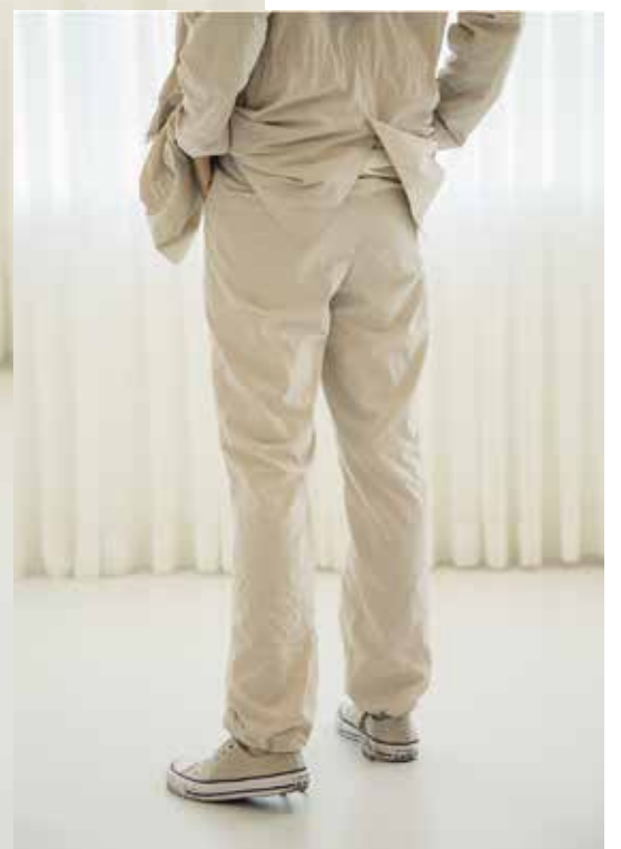
자켓 [19SJK08001], 팬츠 [19SPN08003] | Designer 정거함