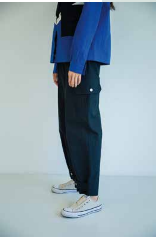
셔츠 [19SSR07001], 팬츠 [19SPN07002] | Designer 임세운