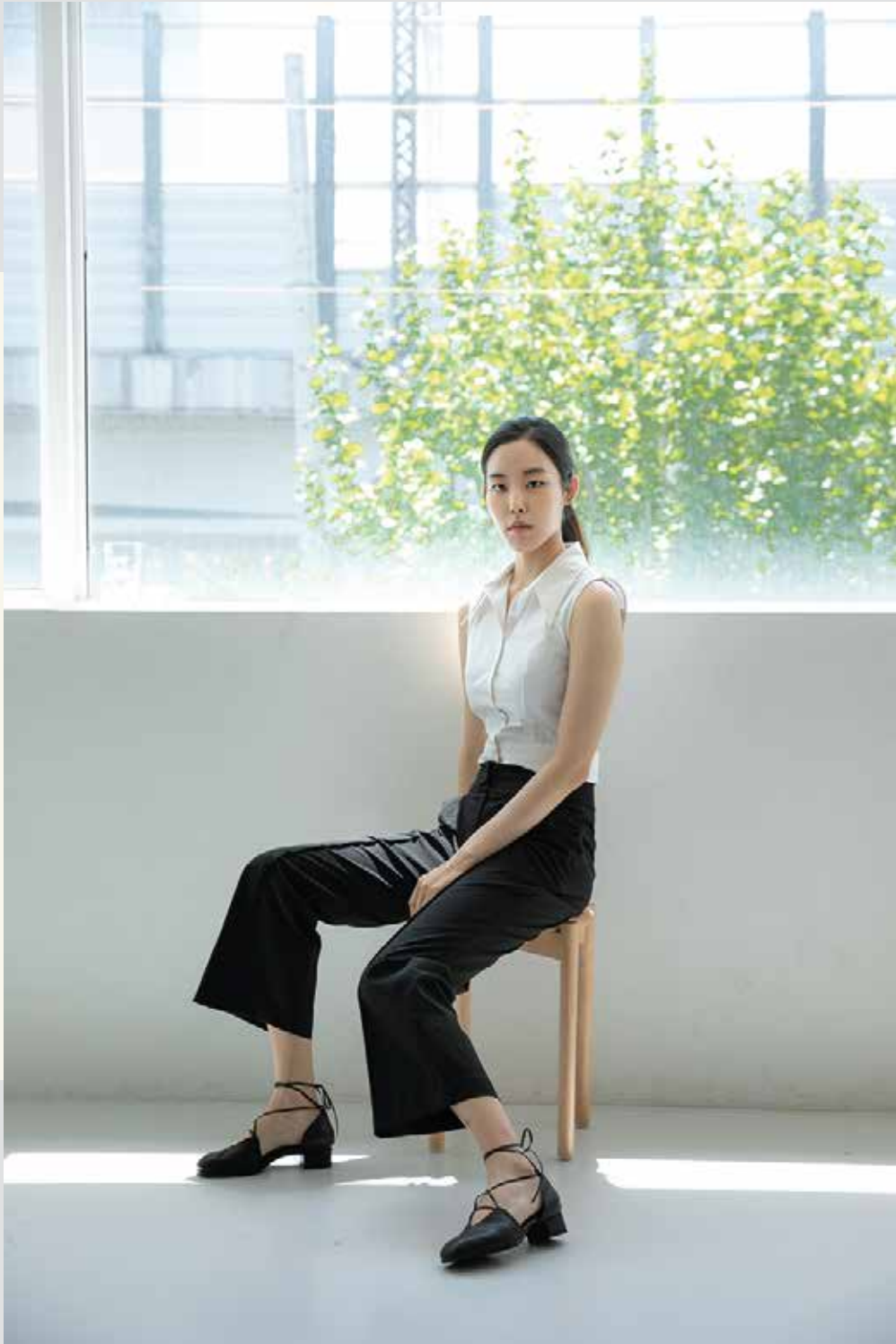
블라우스 [19SBL10001], 팬츠 [19SPN10002] | Designer 한지원