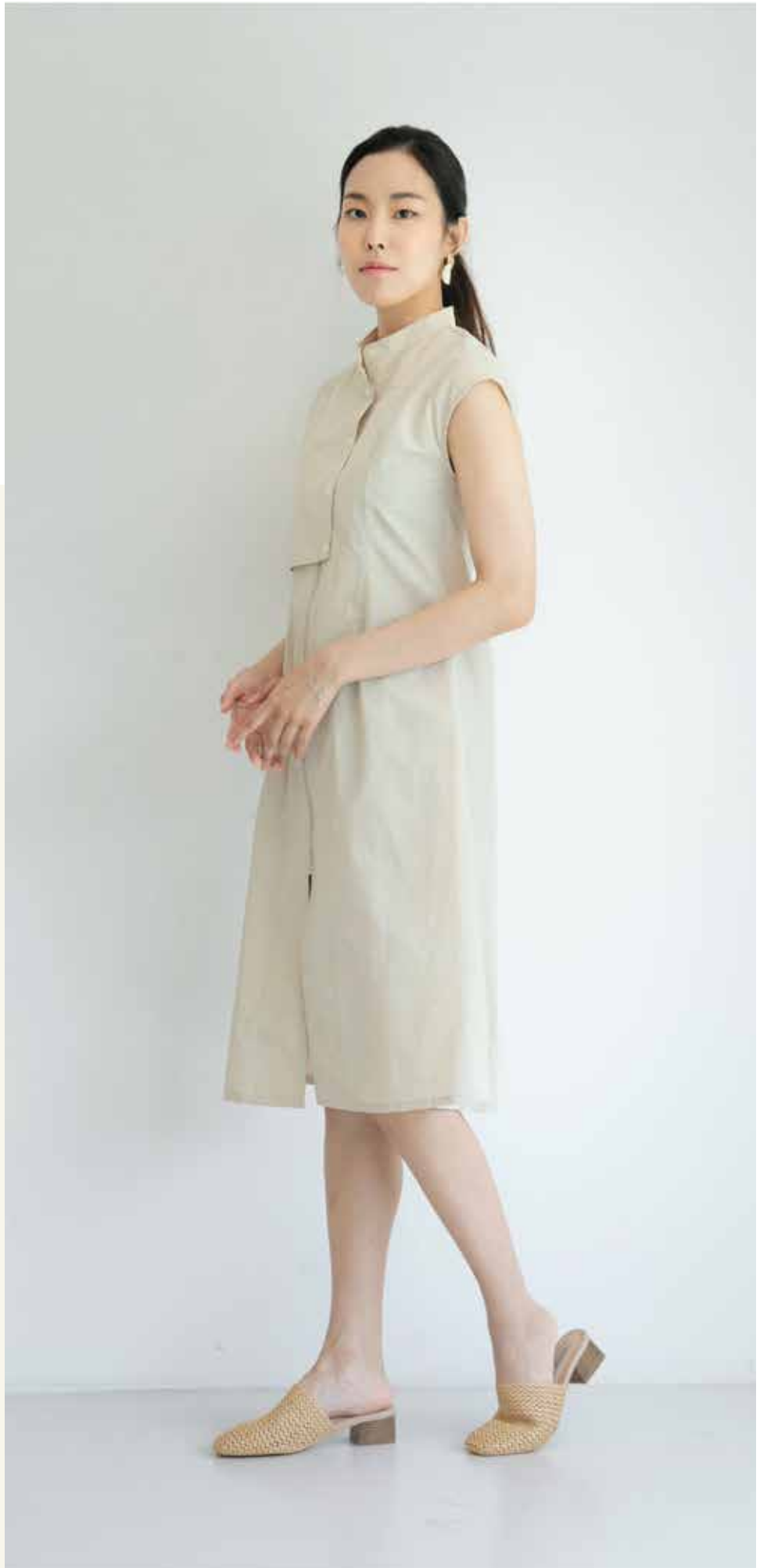
원피스 [19SOP01002] | Designer 김인애