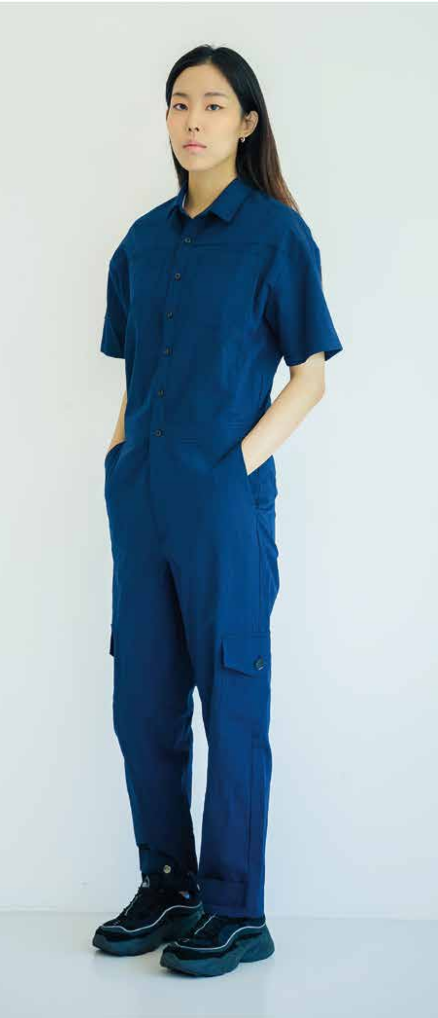
점프수트 [19SJS07003] | Designer 임세윤