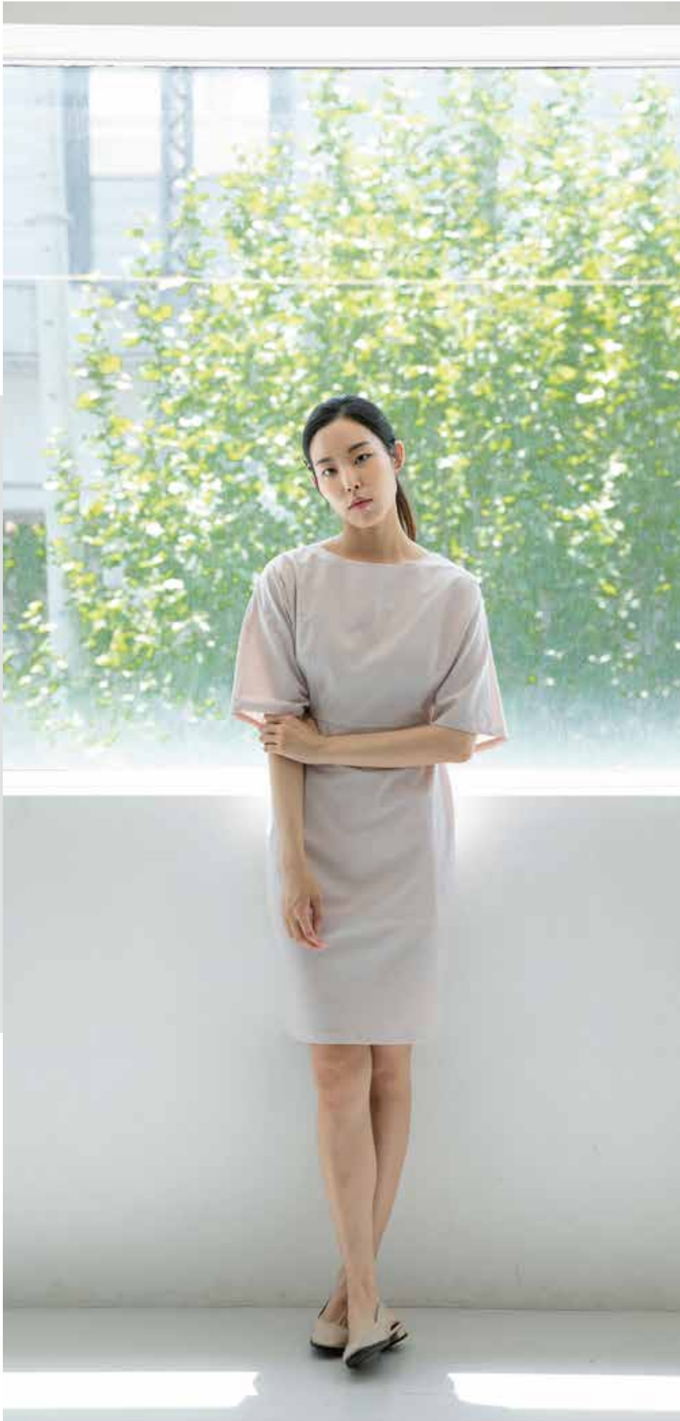
원피스 [19SOP04001] | Designer 최유리