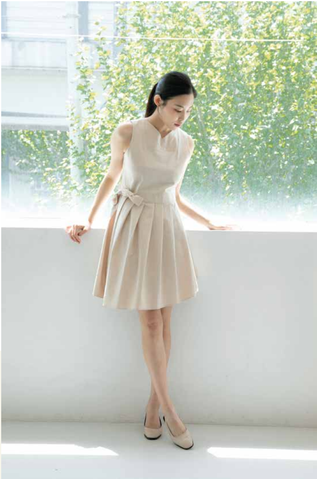
원피스 [19SOP09002] | Designer 감미선