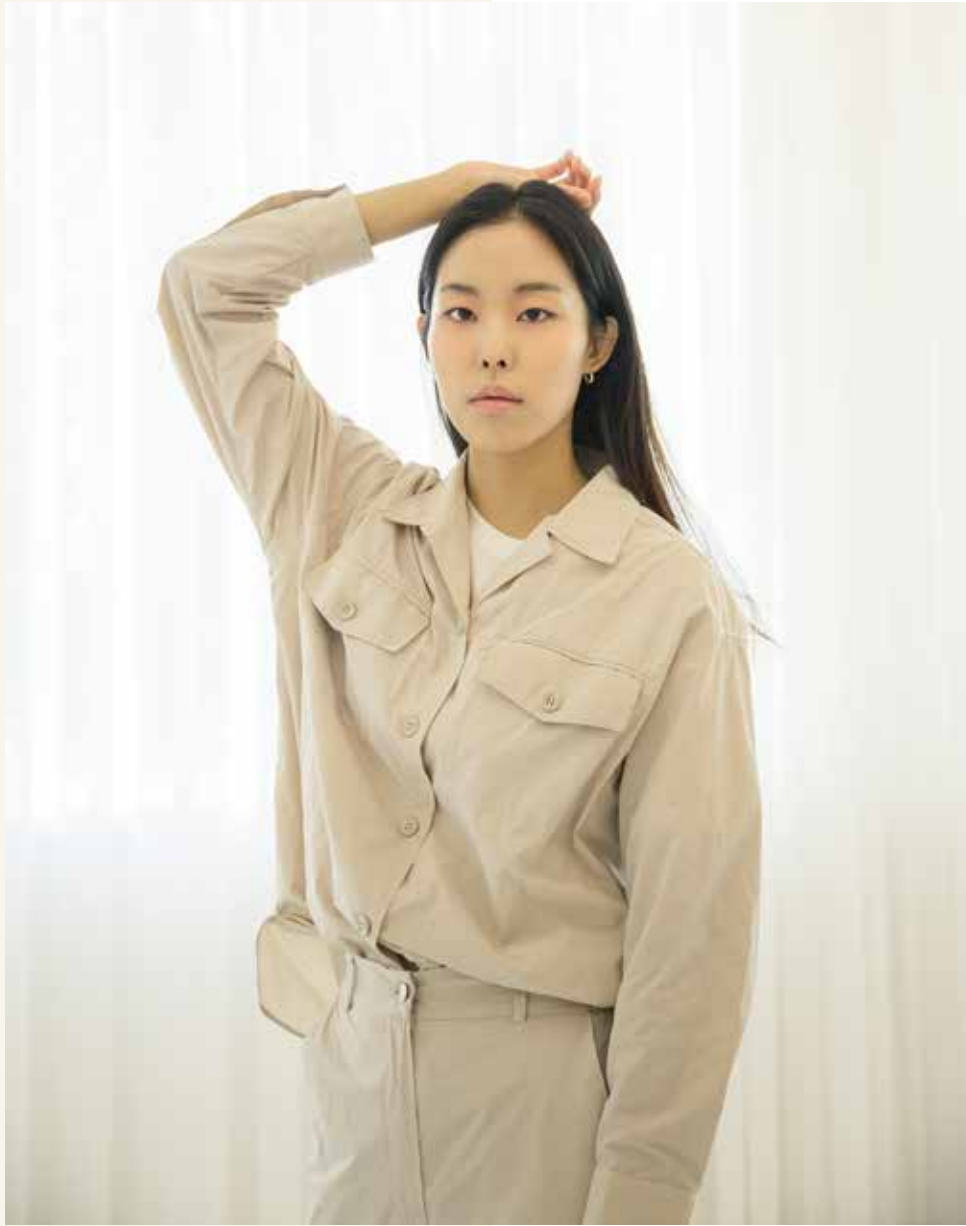
셔츠 [19SSR08002] | Designer 정거함