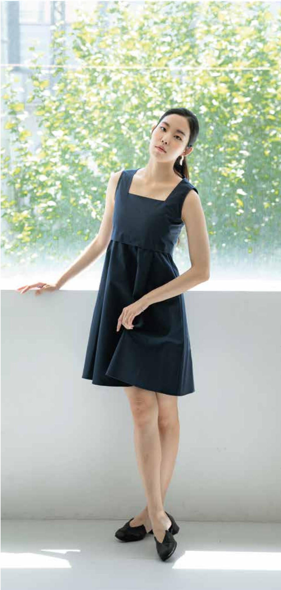
원피스 [19SOP01001] | Designer 김인애