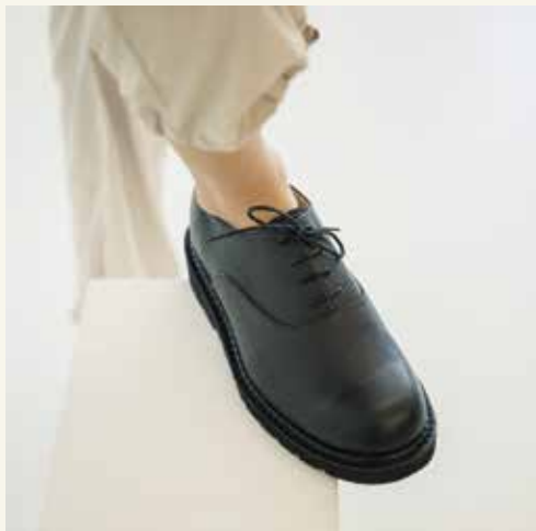
남성화 [이태리제화] | Master 고기황, Designer 정거함