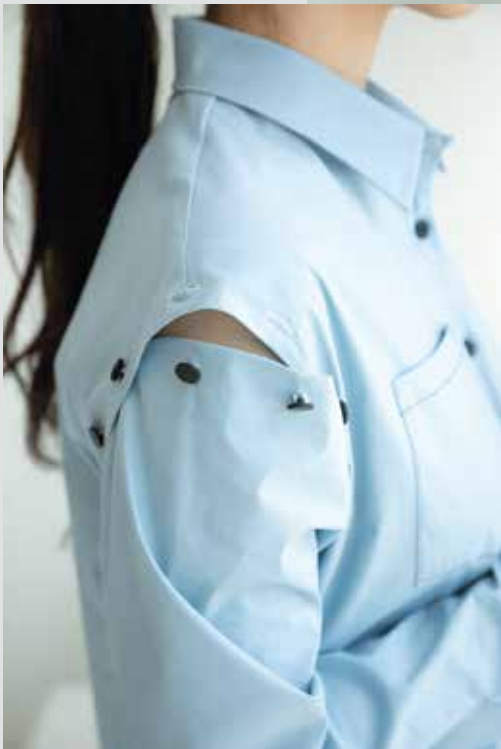
원피스 [19SOP03002] | Designer 조민선