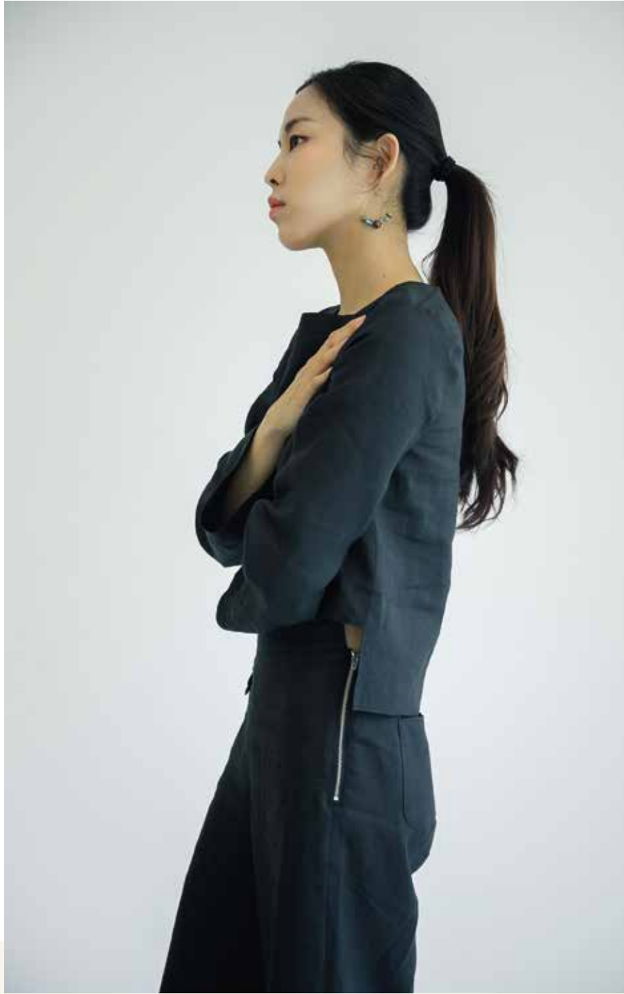
블라우스 [19SBL06001], 팬츠 [19SPN06002] | Designer 박채원