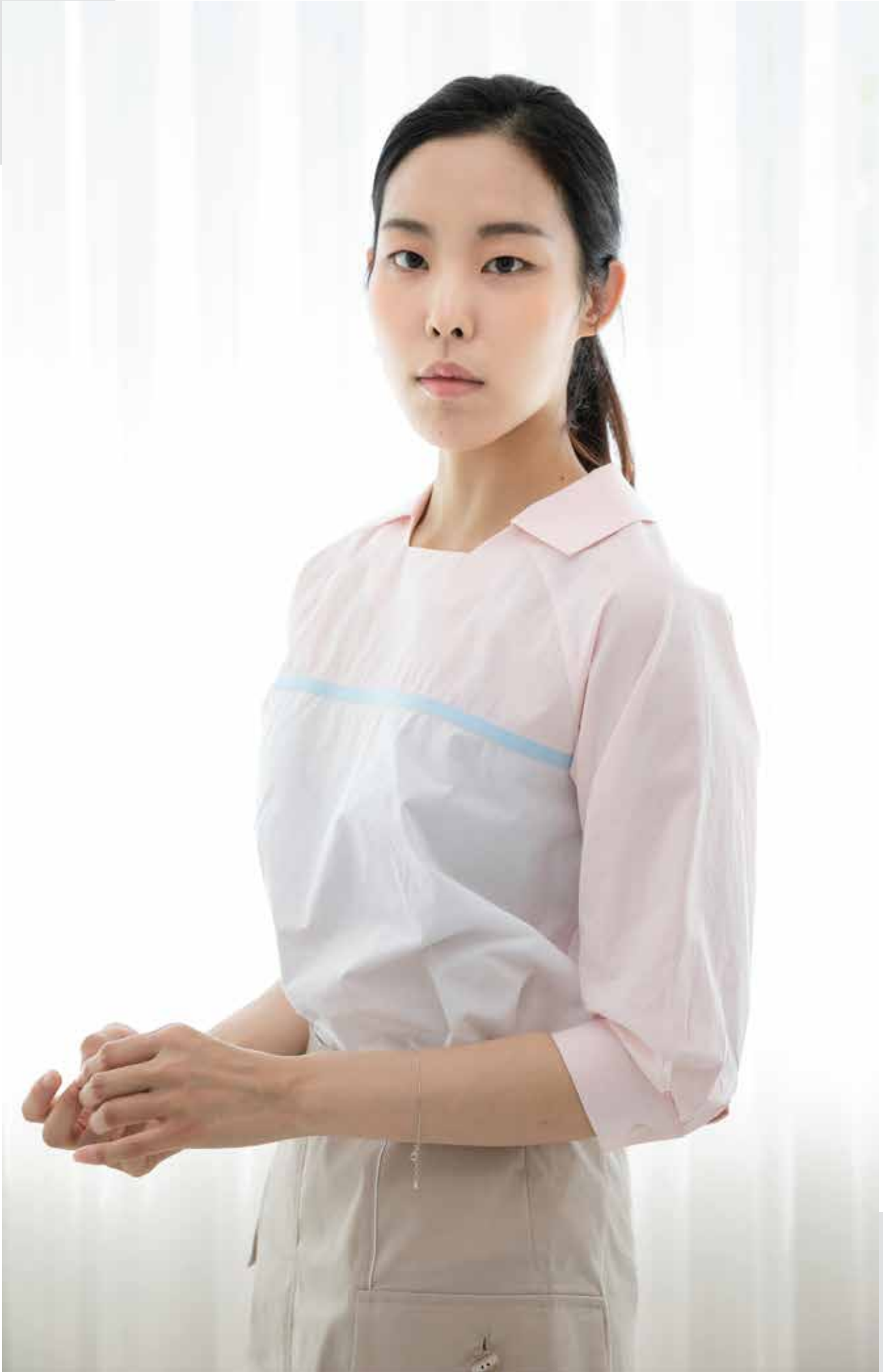
셔츠 [19SBL03004] | Designer 김하연