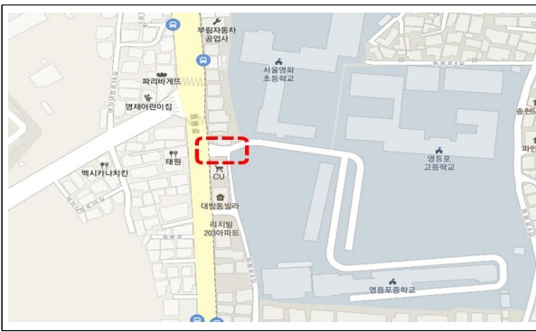
[ 영화 초등학교 ]