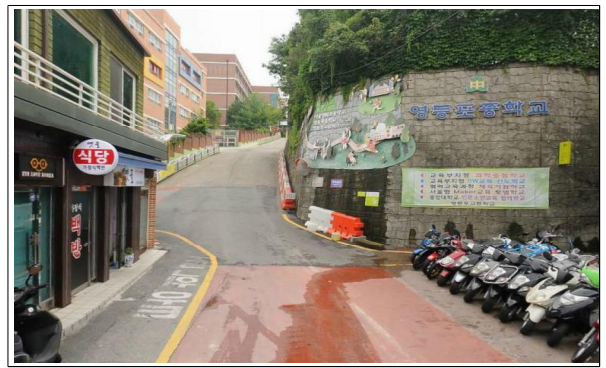
[ 영화 초등학교 ]