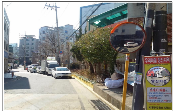
[ 당곡 초등학교 ]