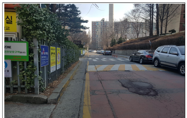
[ 압구정 초등학교 ]