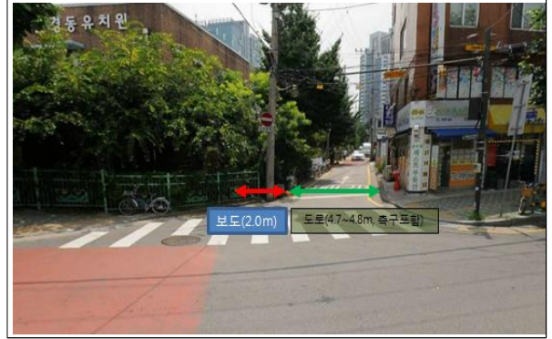
[ 경동 초등학교 ]