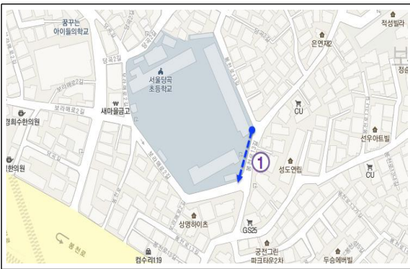
[ 당곡 초등학교 ]