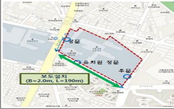
[ 경동 초등학교 ]