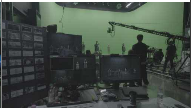
크로마월(Wall) 기반의 XR스튜디오 (문화예술인 XR콘텐츠 제작 현장)