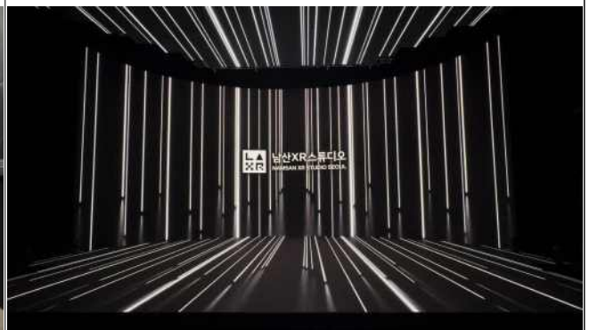
LED월(Wall) 기반의 XR스튜디오