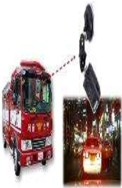
위반차량 단속 (현장대응단 및 119안전센터)