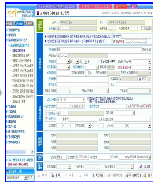
고지서 발부 (구청 주차관리과)