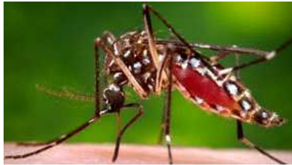
<지카바이러스를 매개하는 숲모기>