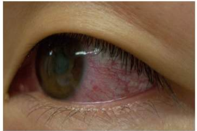
<지카바이러스에 의한 결막염>