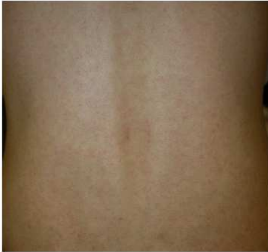
<지카바이러스에 의한 홍반성 구진성 발진>