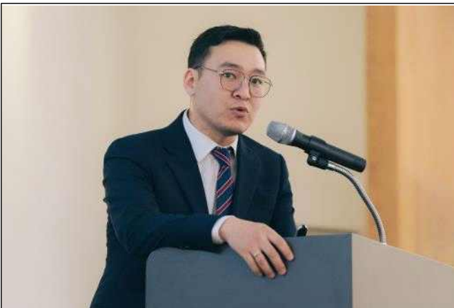
〈몽골 바트볼드 도시계획국장 소감 발표〉