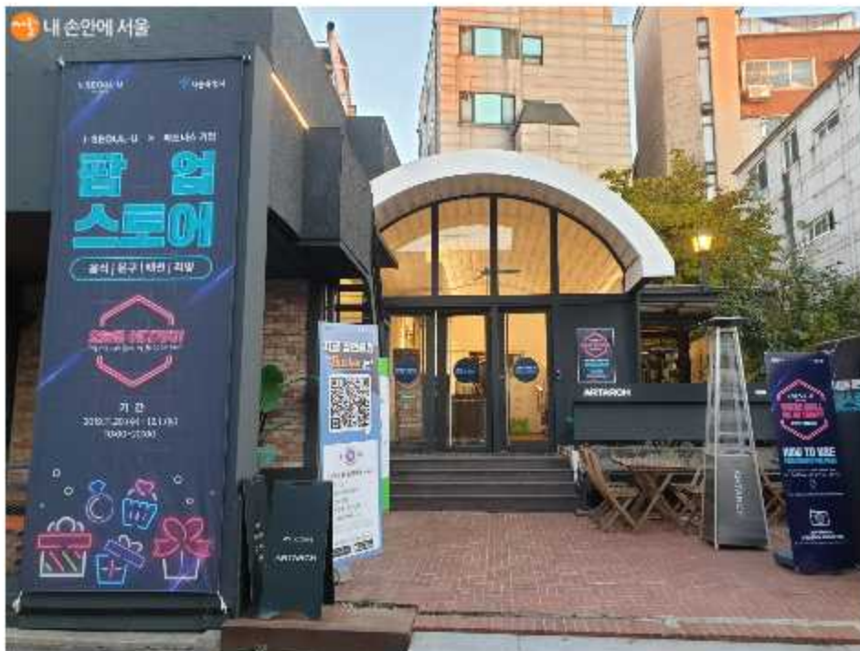
아이서울유 팝업스토어가 열리고 있는 아트아치갤러리

변화가인 홍대인근에 위치해 있는 만큼 더욱 젊은 감성이 돋보이고, 청년층의 시민들은 물론 남녀노소 오며 가며 둘러볼 수 있는 아이서울유 팝업스토어다.