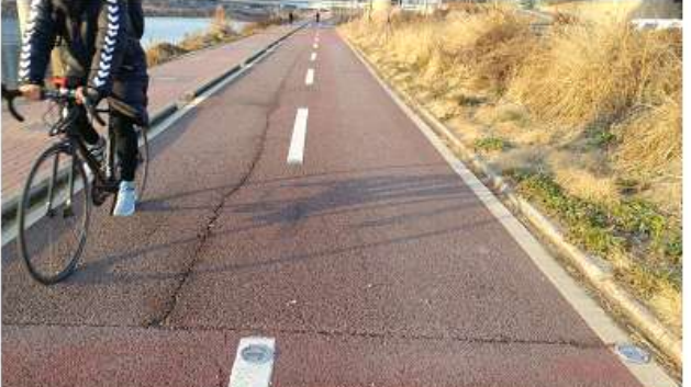
‘17년 정비완료 사진