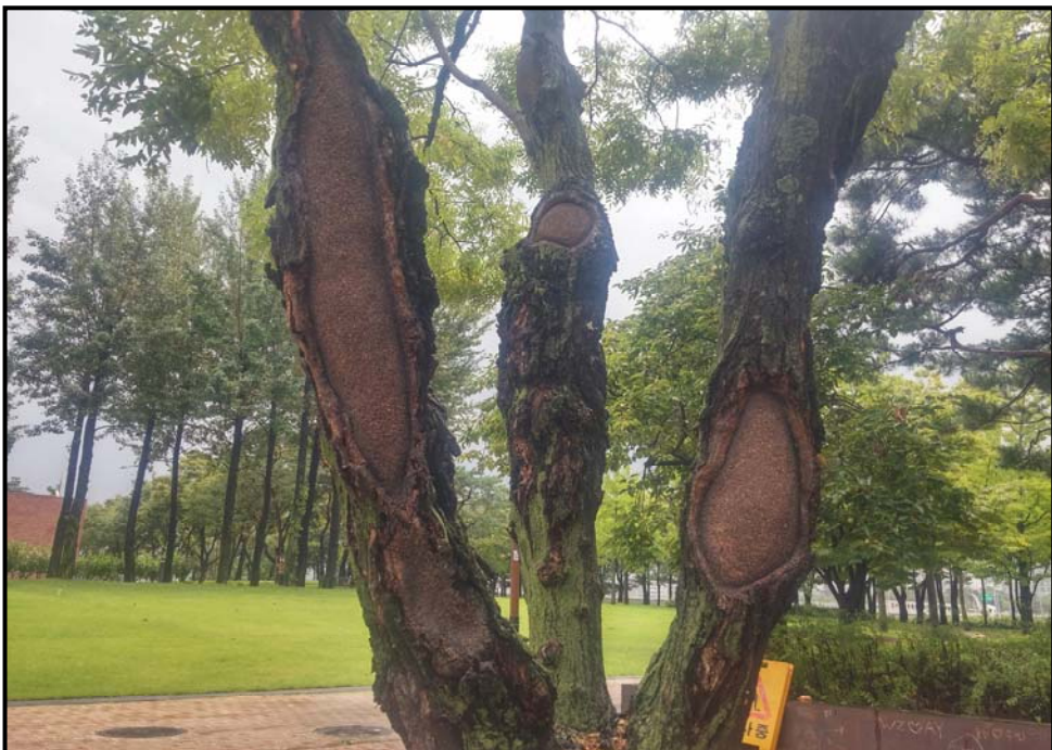
외과 수술 후