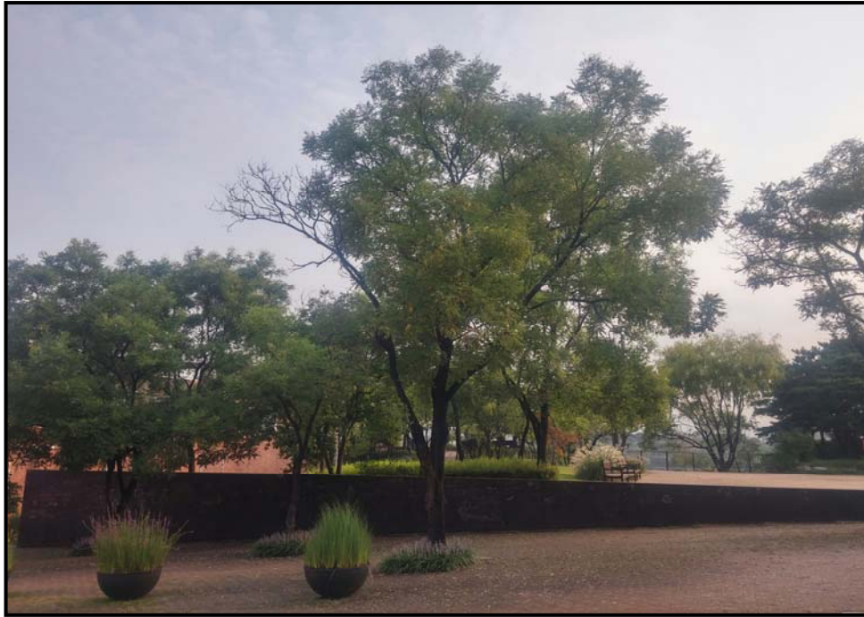
수관 숙기 전