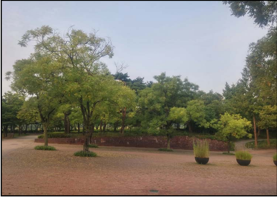
수관 숙기 전