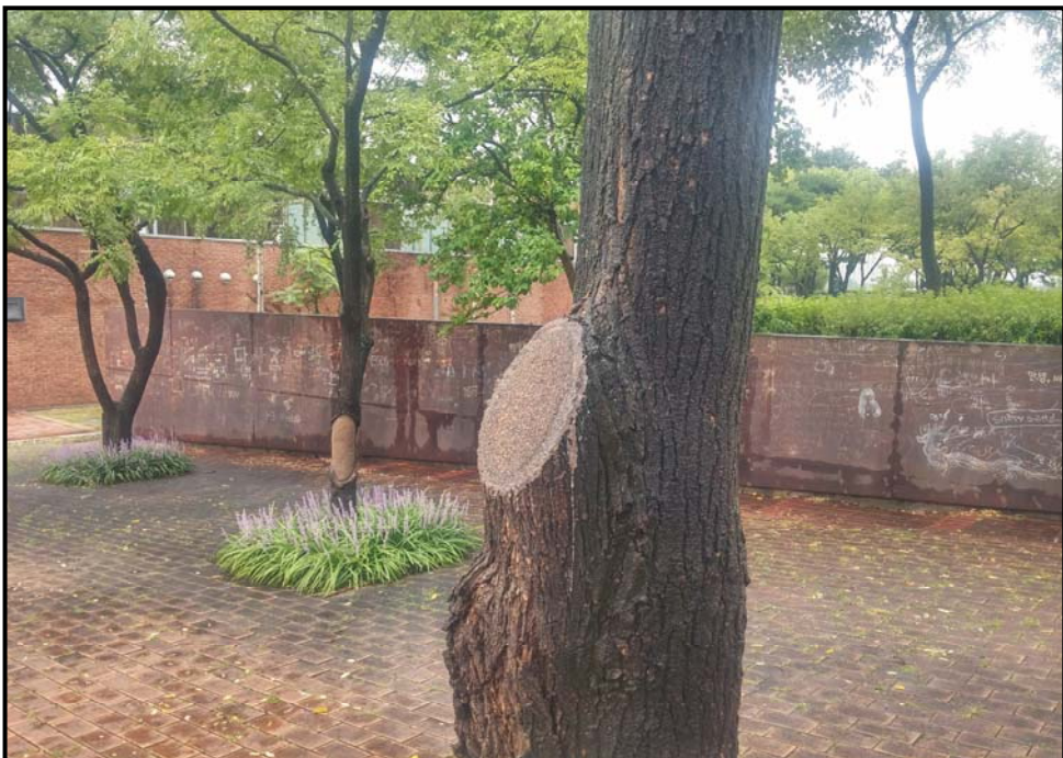
외과 수술 후