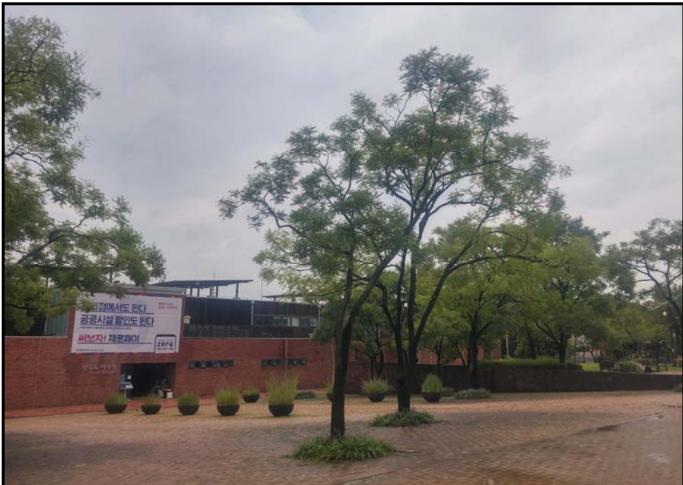
수관 축기 후