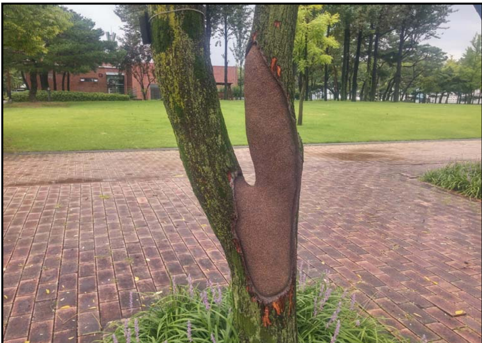
외과 수술 후