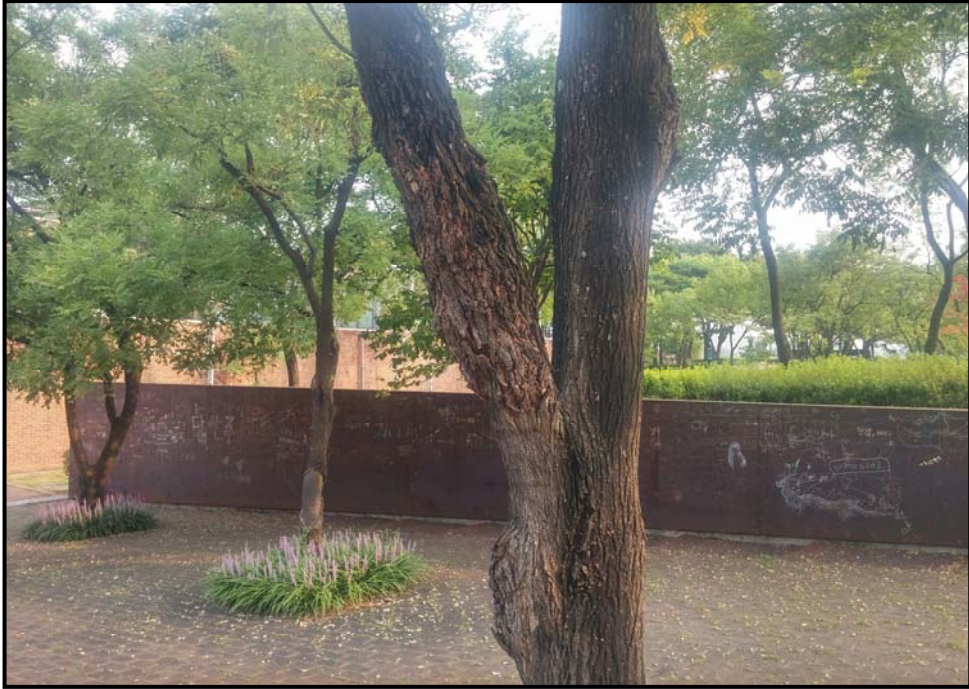
외과 수술 전