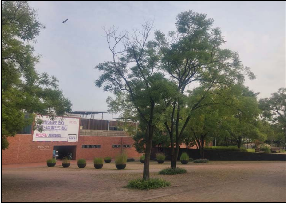
수관 축기 전