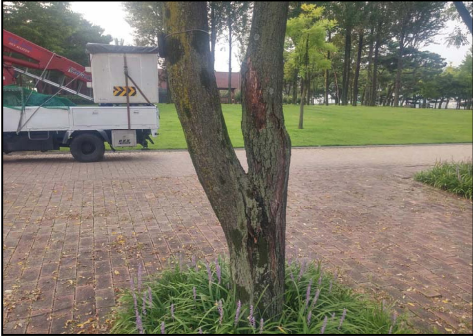
외과 수술 전