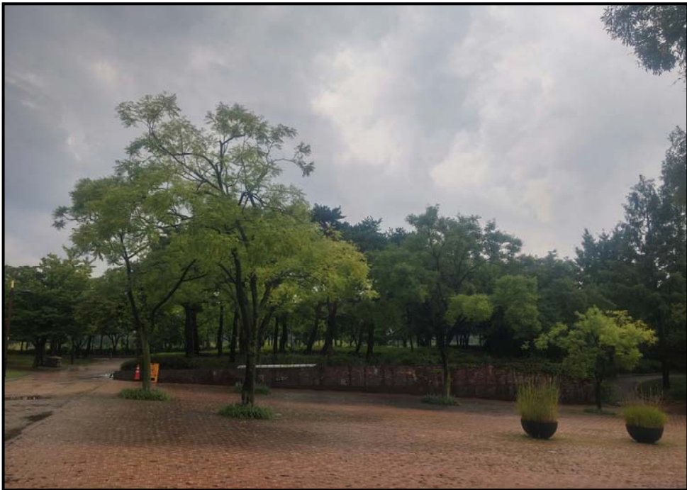
수관 숙기 후