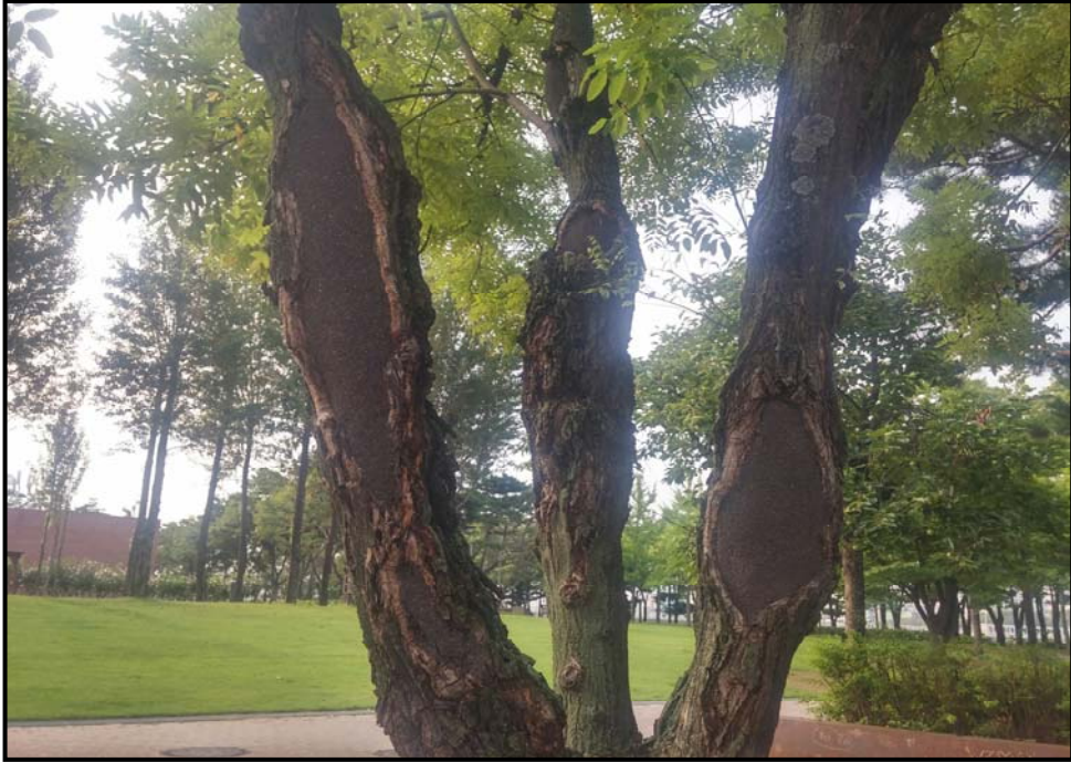
외과 수술 전