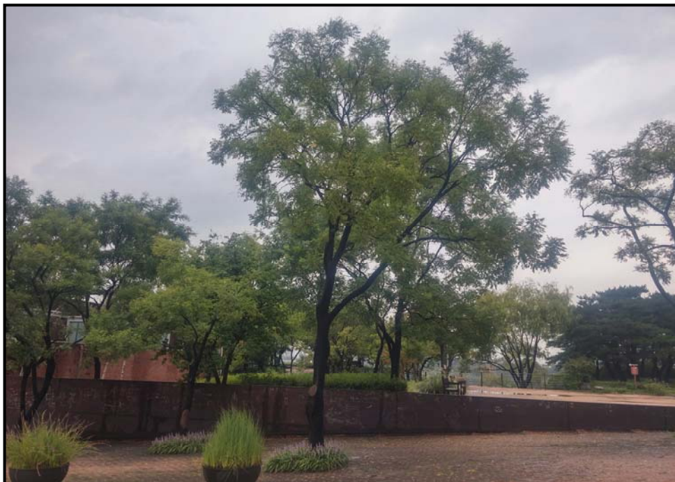
수관 숙기 후