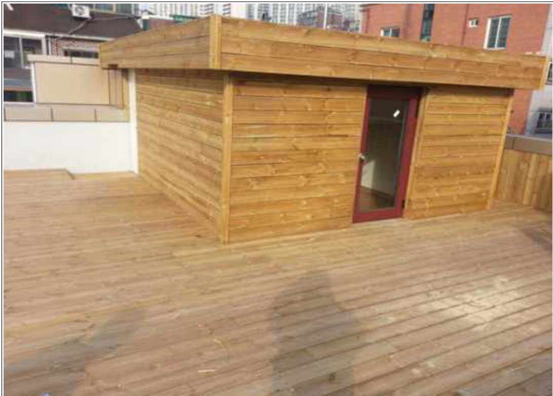
내용 : 옥탑 전경