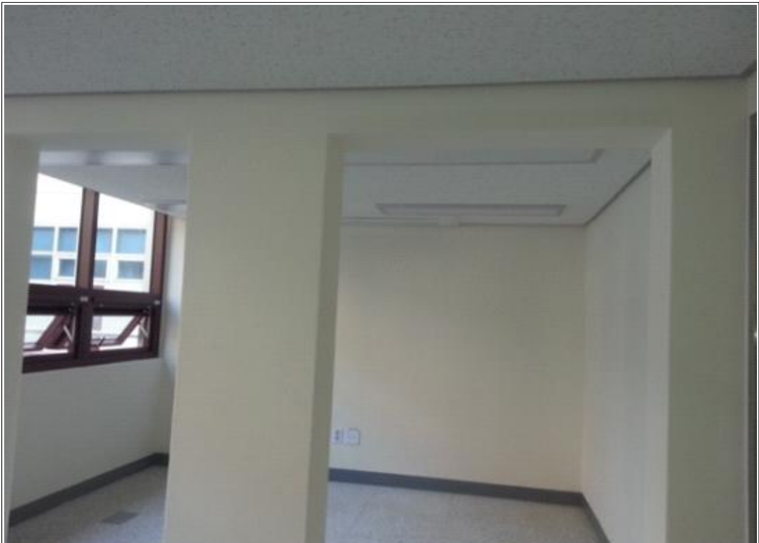
내용 : 2층 센터 사무실