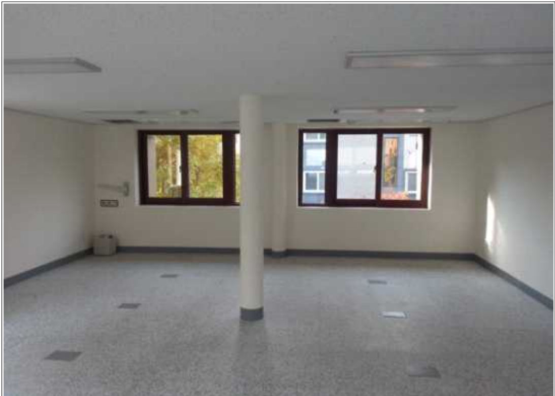
내용 : 3층 창작실