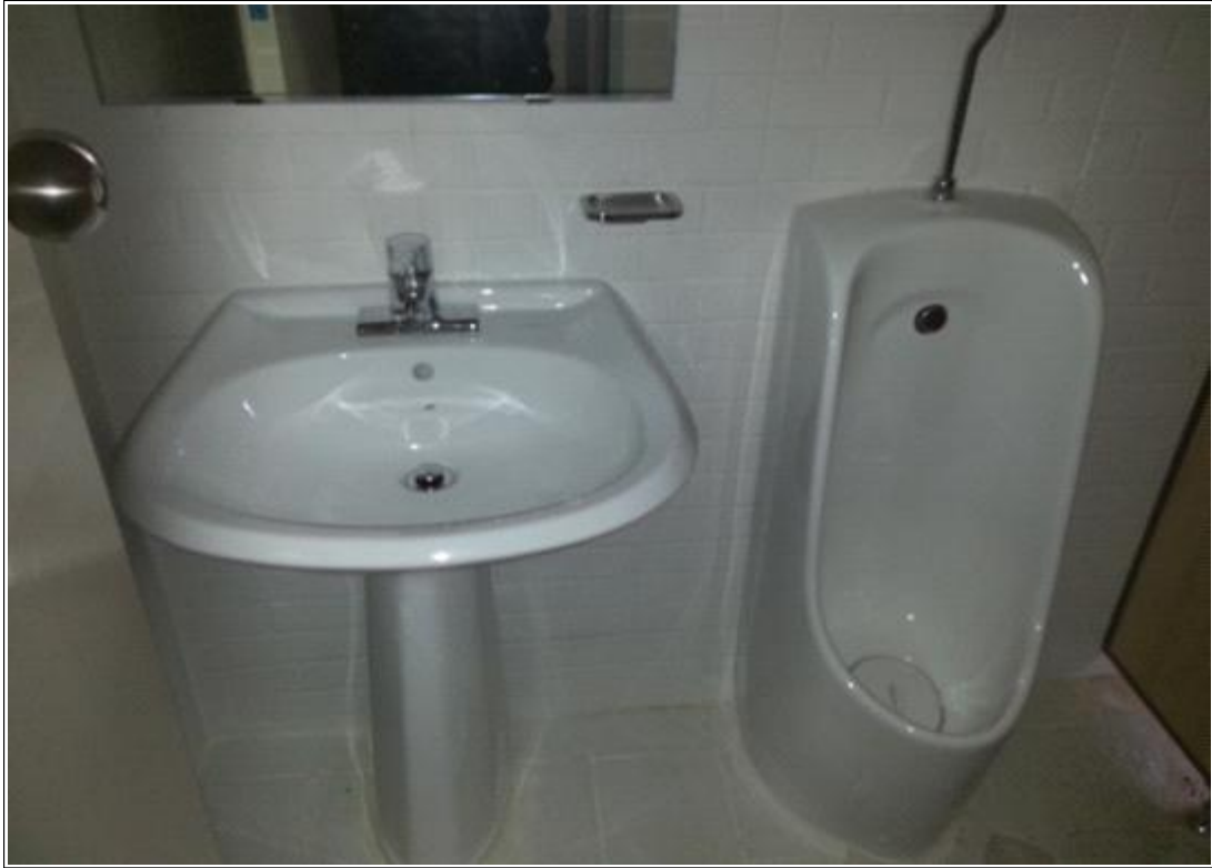
내용 : 화장실 내부