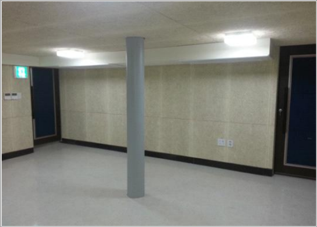
내용 : 지하1층 합주실