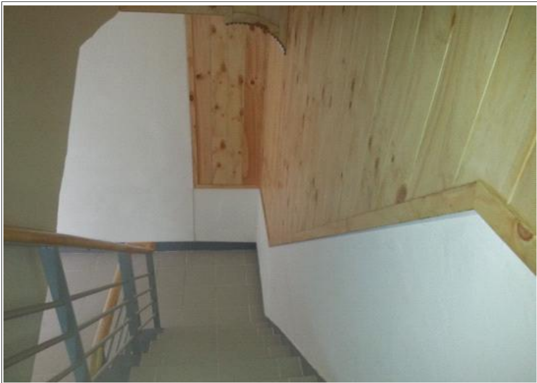
내용 : 내부 계단실