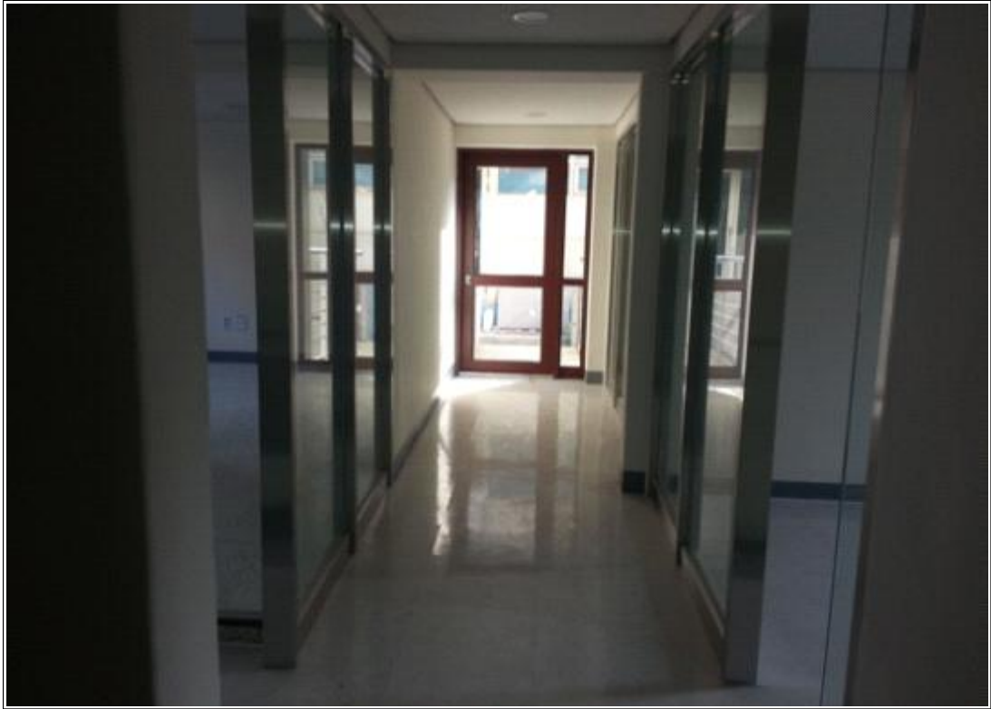
내용 : 2층 복도