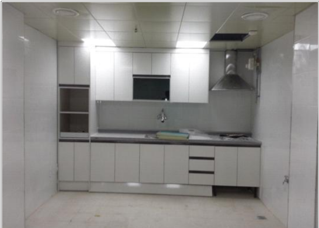
내용 : 주민센터 지하1층 주방