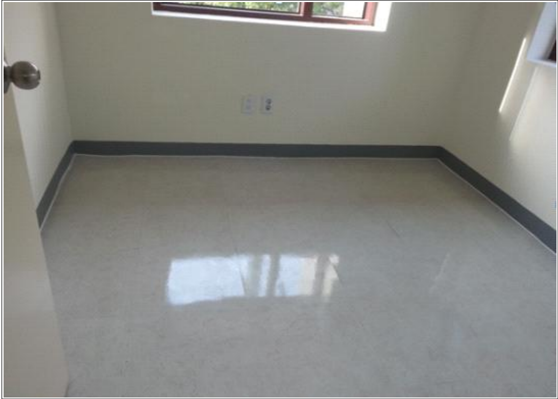
내용 : 3층 창작사무실