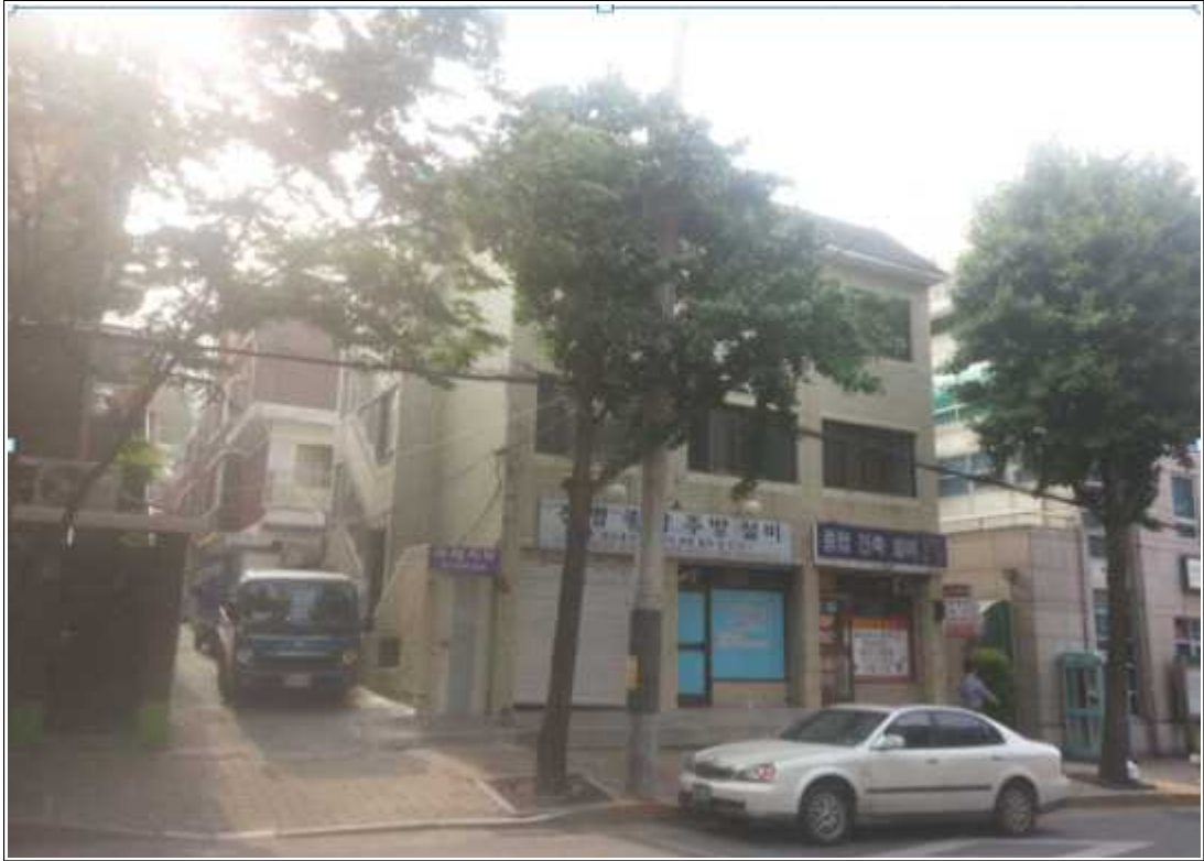
내용 : 전경사진(공사전)