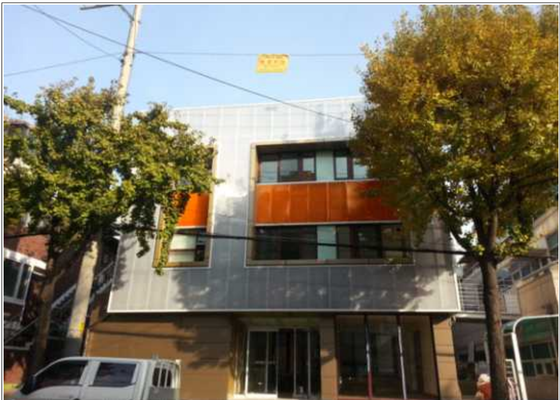
내용 : 전경사진(공사후)