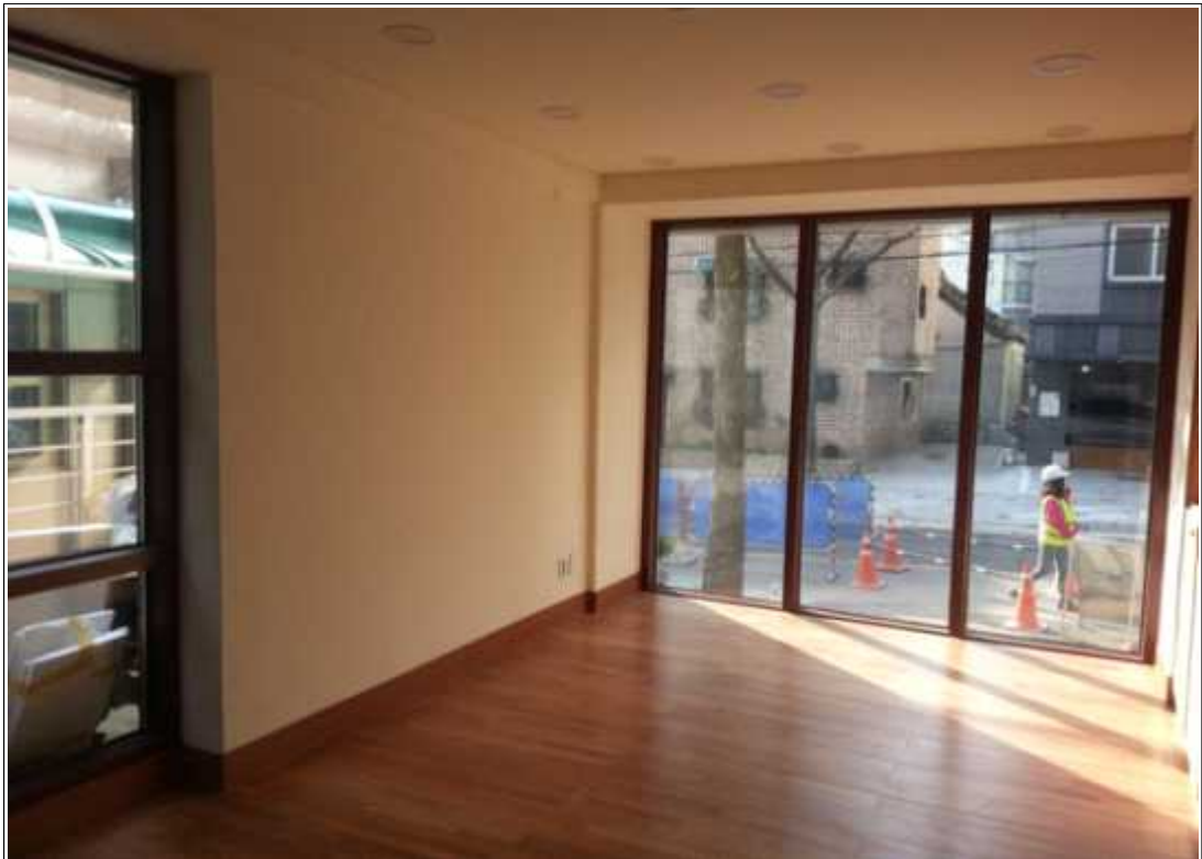
내용 : 1층 휴카페