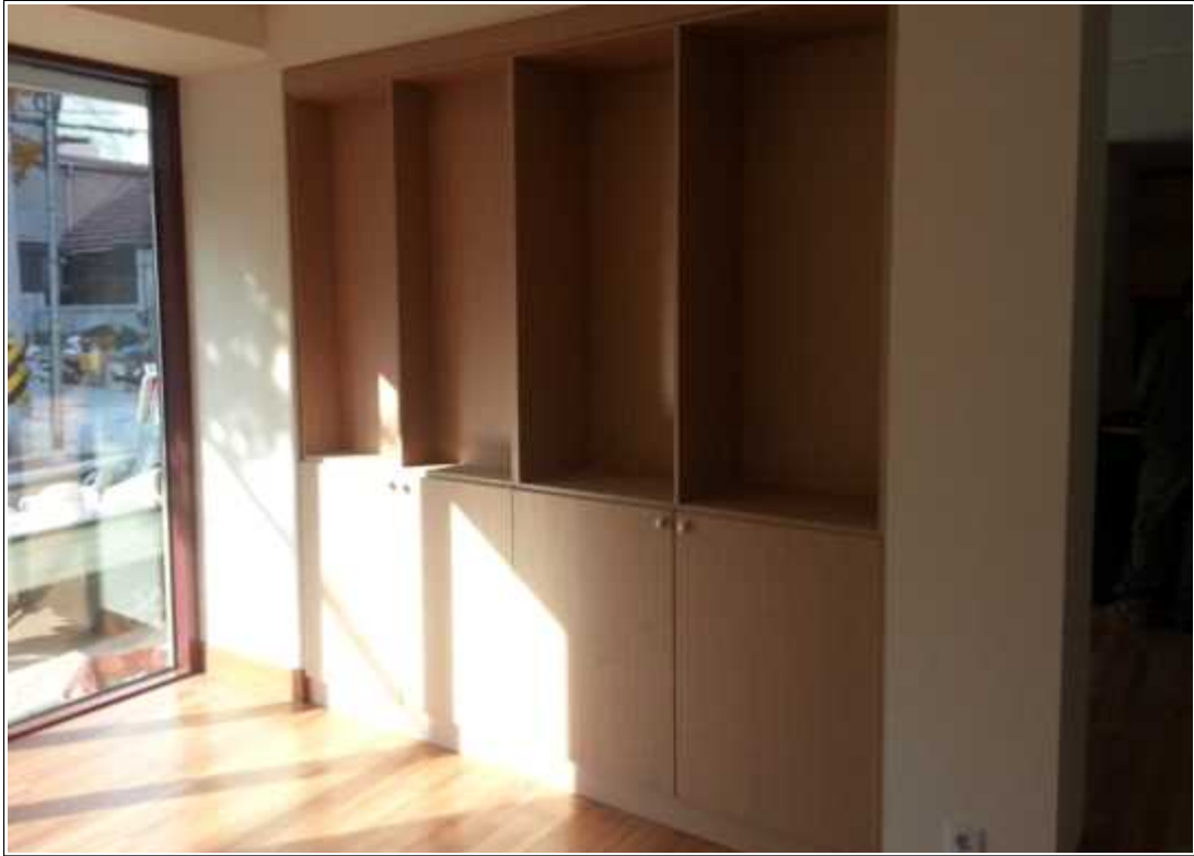
내용 : 1층 휴카페