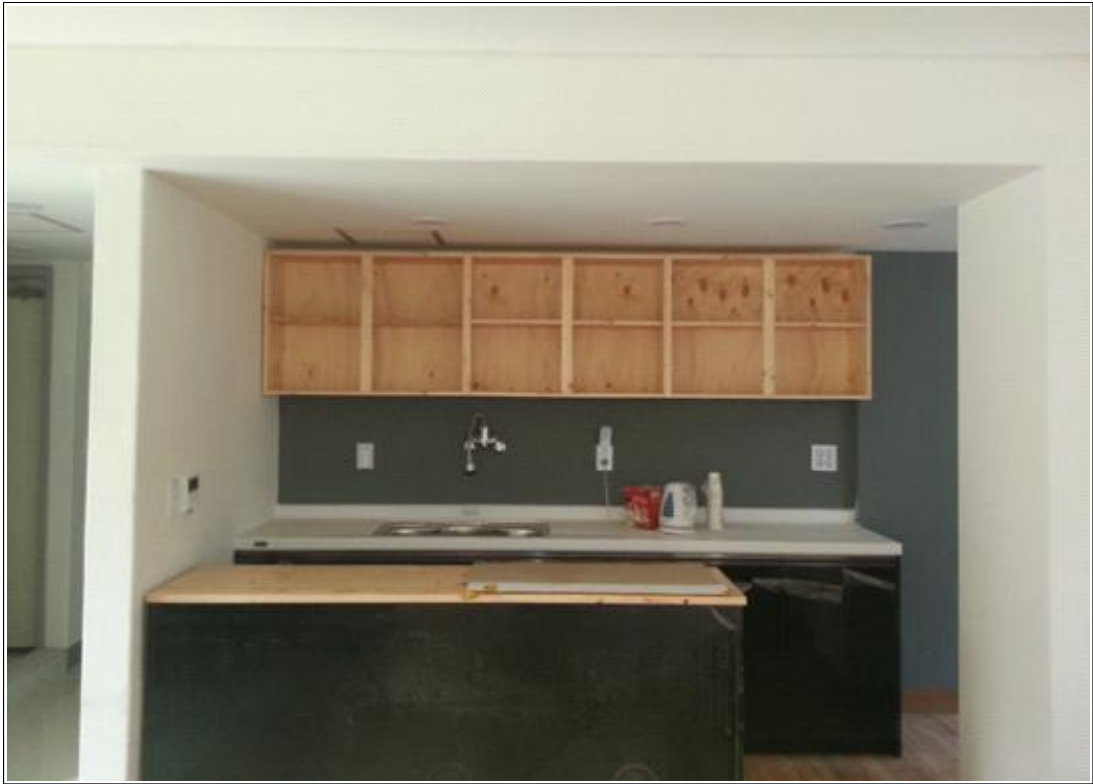
내용 : 1층 휴카페