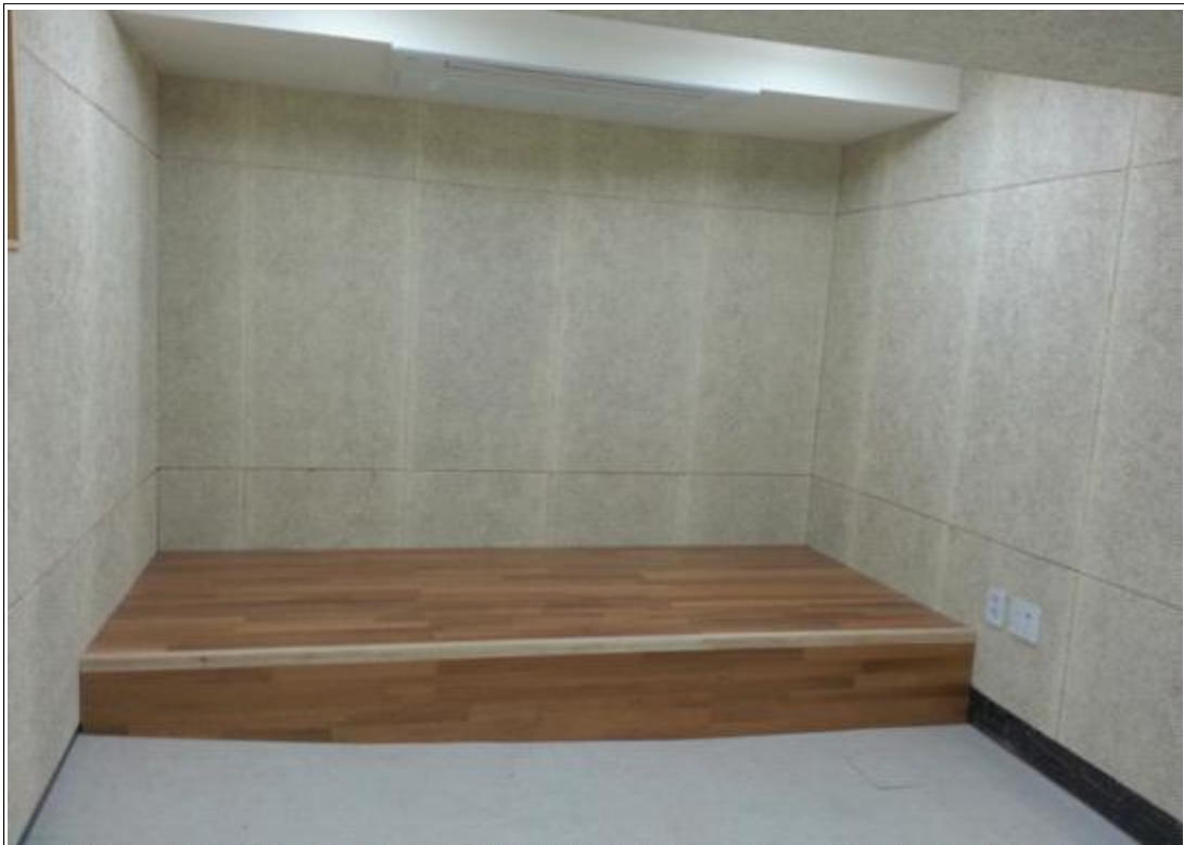
내용 : 지하1층 노래방