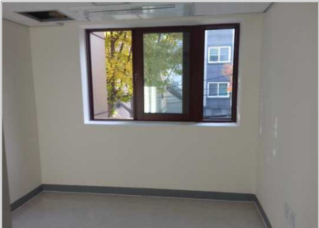
내용 : 2층 동아리모듬실