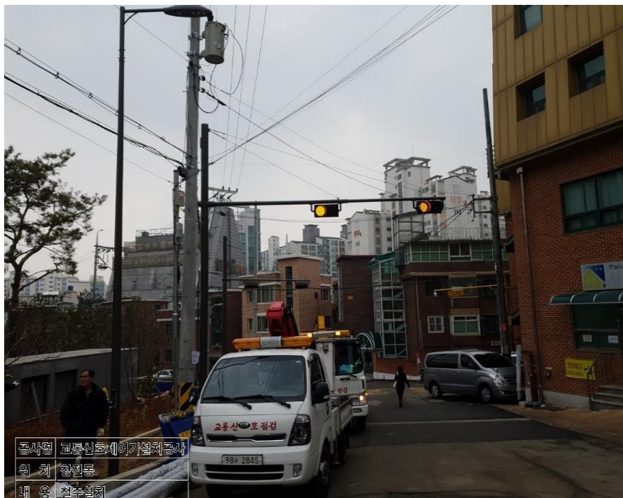
공사명 교통신호제어기설치공사 위 치 창전동 내 용 경보지주설치