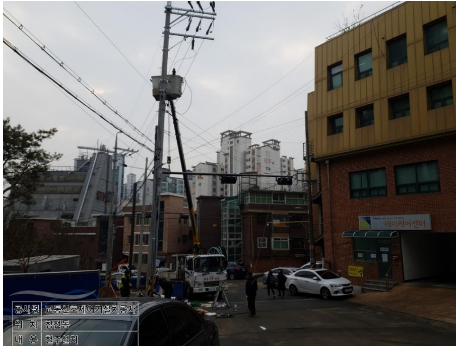
공사명 교통신호제어기설치공사 위 치 창전동 내 용 경보지주설치