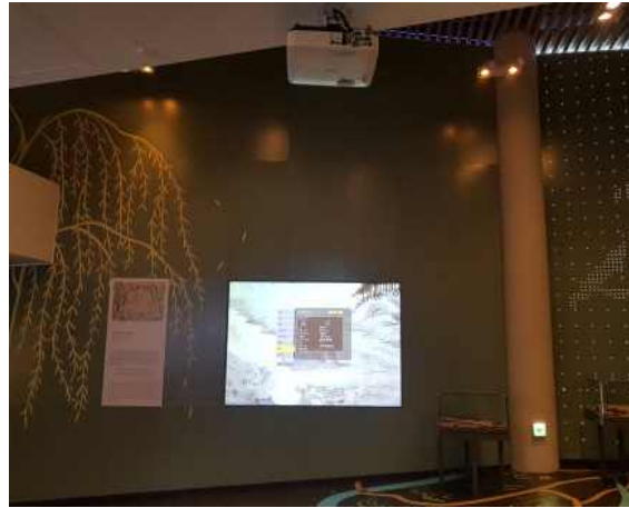
램프 교체 완료