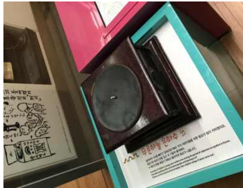
축음기 하판 고정 완료