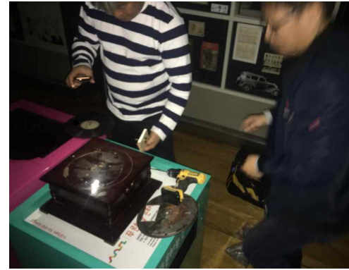
내부 내사 고정 완료