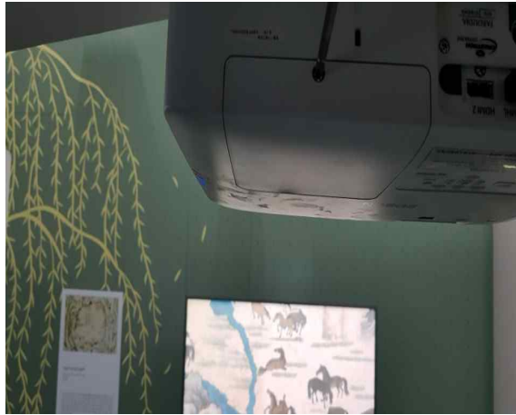
아랫대와 성저십리 램프 교체