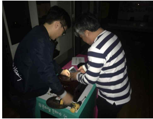
축음기 내부 나사 고정