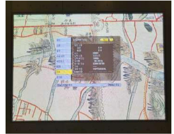
램프 사용시간 초기화