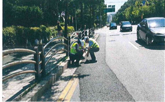
2-48차 광평로(한전) 현장점검