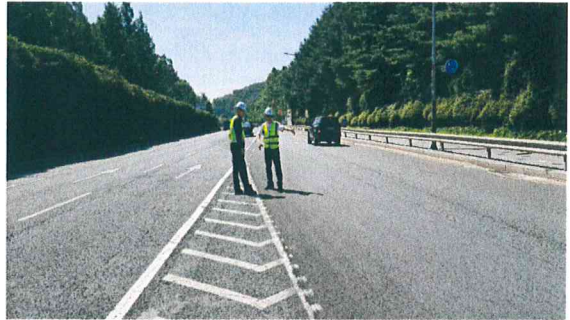
2-59차 방고개로(한전) 현장점검