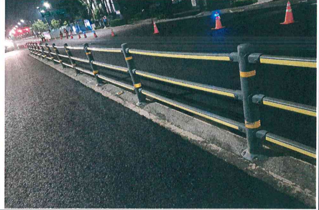
중앙부 울타리 주변 기존포장 추가 절삭 현지시정조치