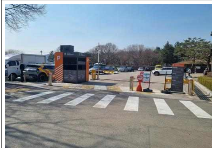
< 암사동 유적 부설주차장 >