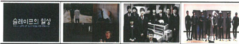
2017. 제11회 청소년 119안전뉴스 전국대회 출전 참고자료