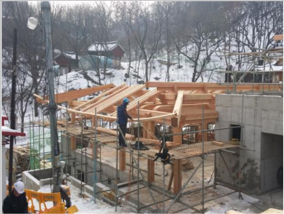
내용 : 1층 평고대 설치작업