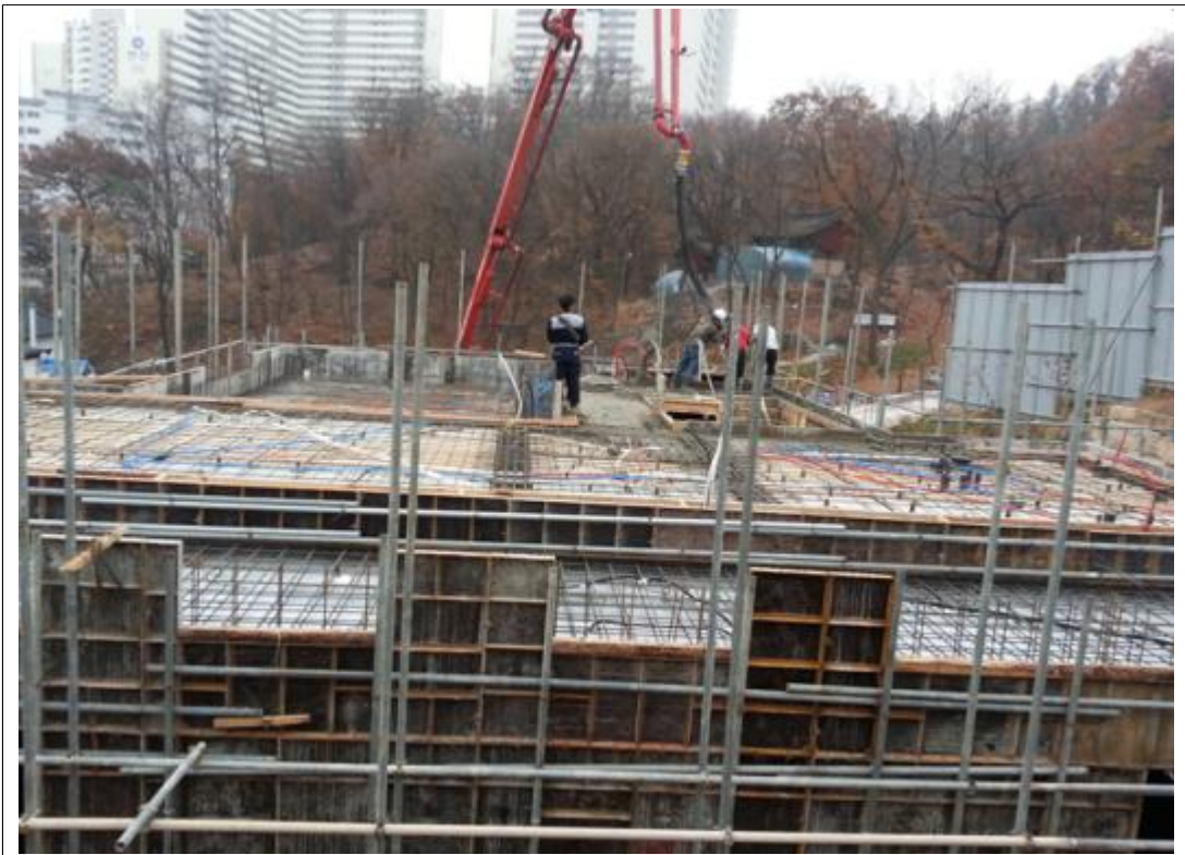
내용 : 2층 바닥콘크리트 타설