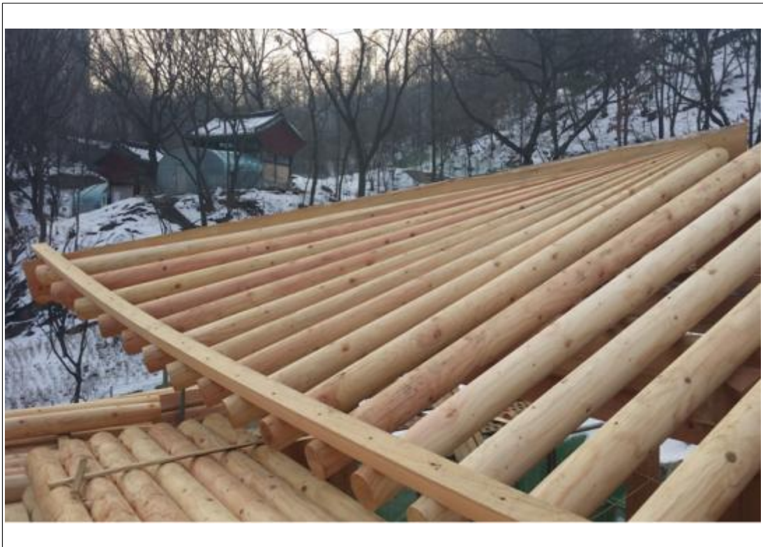
내용 : 1층 선자연 조립작업