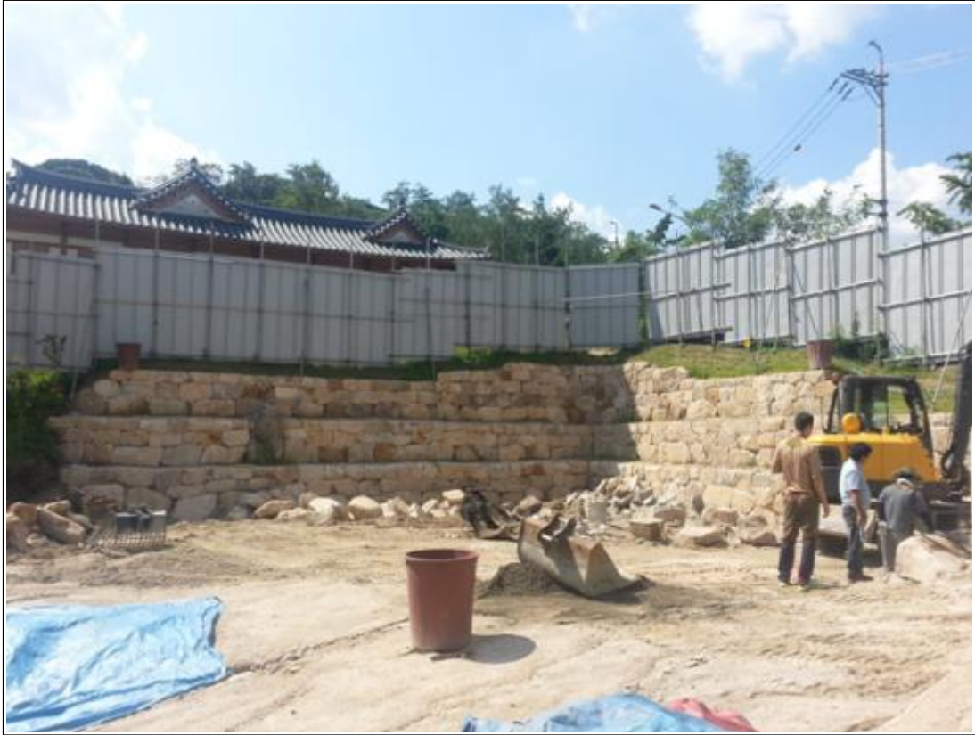
내용 : 전경사진(석축공사)