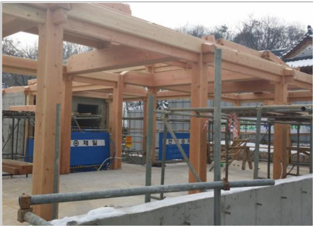
내용 : 2층 보, 도리 설치작업