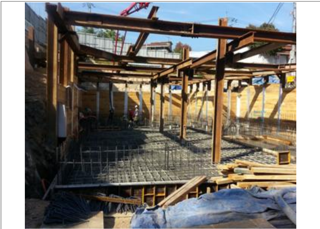
내용 : 기초공사