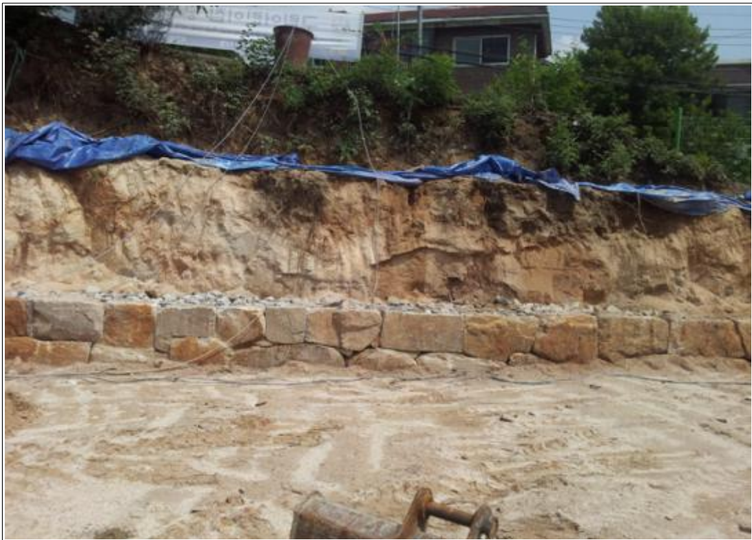
내용 : 전경사진(석축공사)