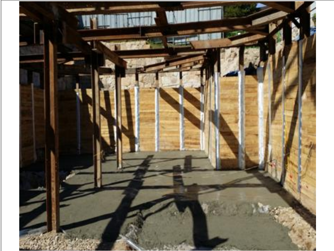
내용 : 가시설공사 완료