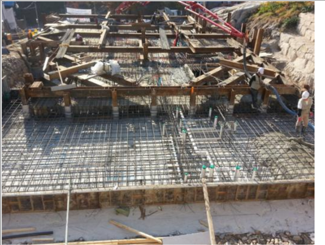
내용 : 1층 바닥 콘크리트 타설