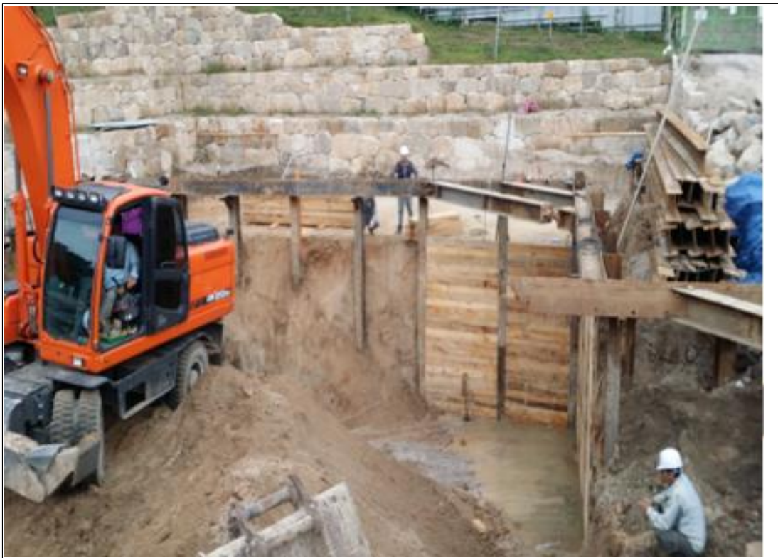
내용 : 토푸판 설치