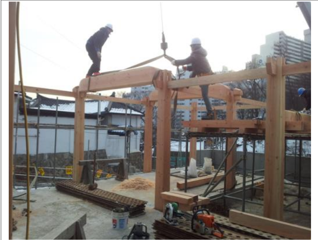
내용 : 2층 보, 도리 설치작업