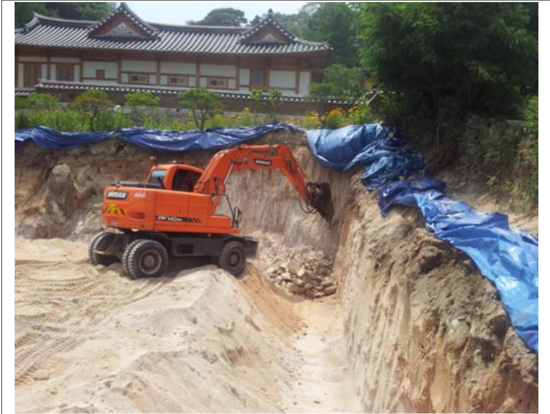
내용 : 전경사진(석축공사)