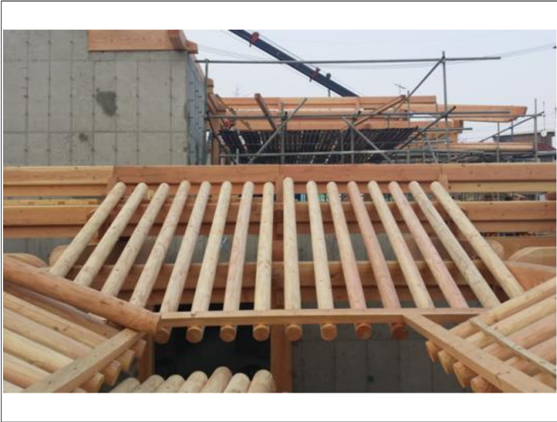
내용 : 평연조립