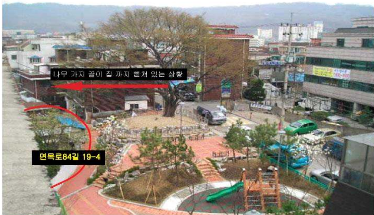
보호수 및 사업대상지 사진(원경)