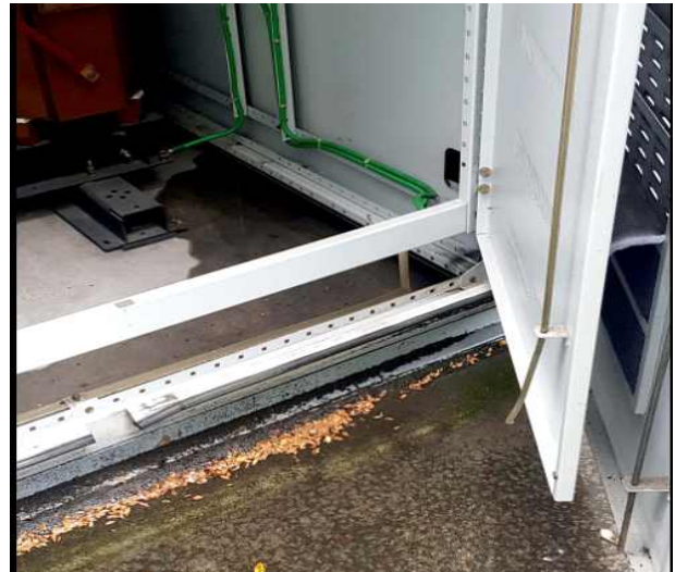
빗물 유입상태 확인