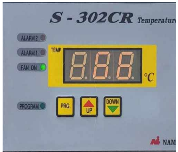
변압기 온도 확인 68 (°C)