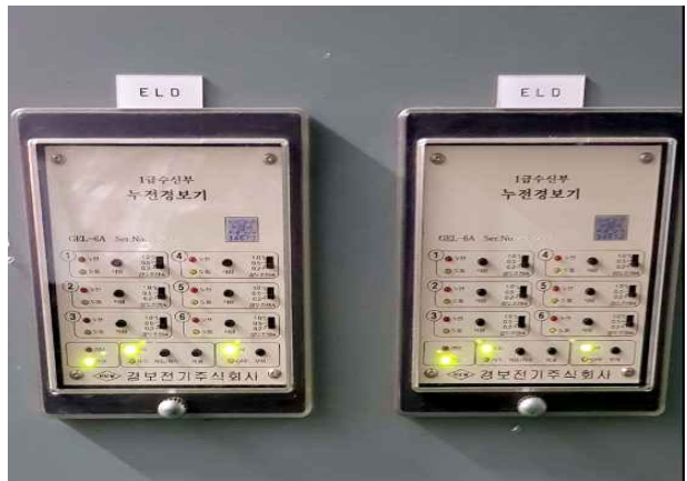
뚝섬벽천분수-누전경보기 경보상태 확인