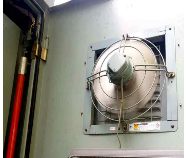
수배전반 FAN 동작상태 확인