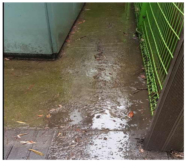
주변 물고임 상태 확인