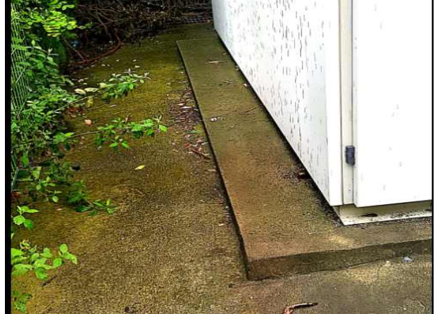
난지거울- 주변 물고임상태 확인