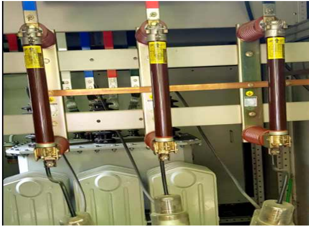
난지거울- 고압기기 POWER FUSE 상태