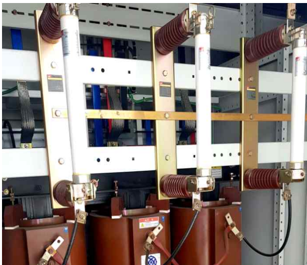
내부 고압애자련 상태 확인