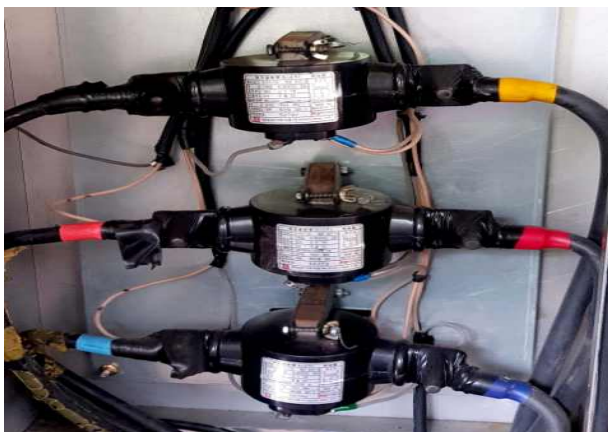
난지물놀이장- 인입 케이블 상태 확인