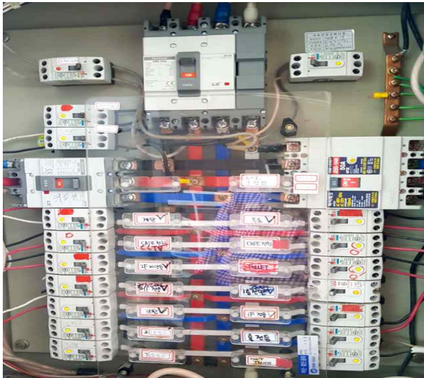
CAFE 분전반 내부회로 상태 확인