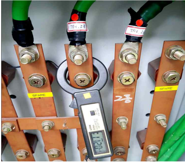
제2종 접지선 누설전류상태 확인