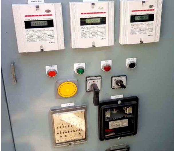
OCGR 및 누전경보기 상태 확인