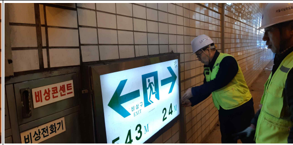
램프 보수 완료 후