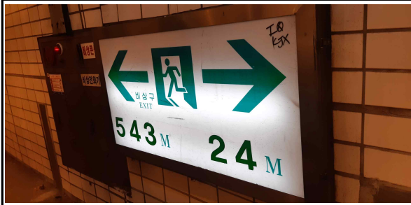
거리표시 유도등 램프 1개 불량