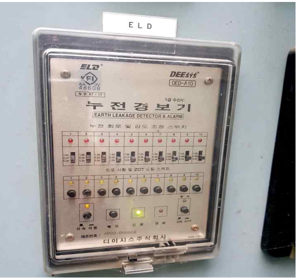
누전경보기 경고상태 확인