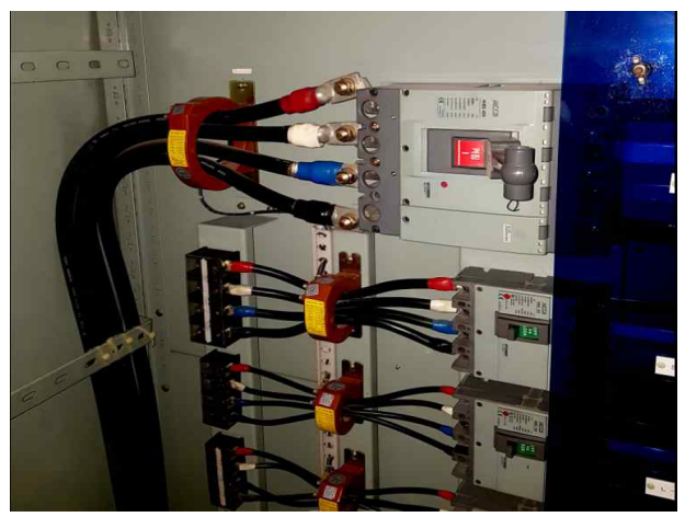
뚝섬벽천분수- 내부 회로상태 확인