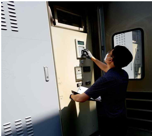
정류기반 배터리 및 DC전압상태 확인