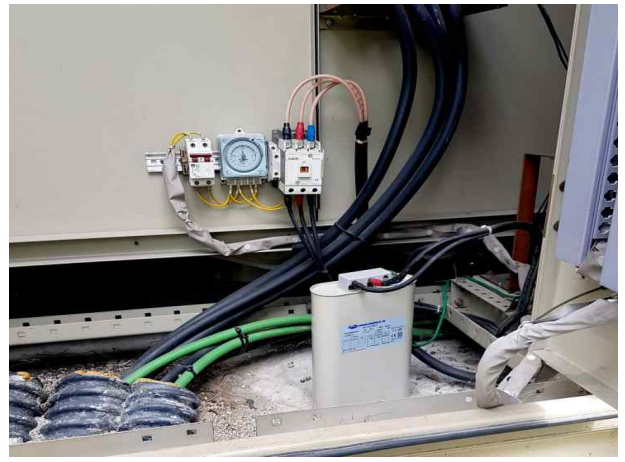
난지거울-콘덴서 동작여부 상태 확인