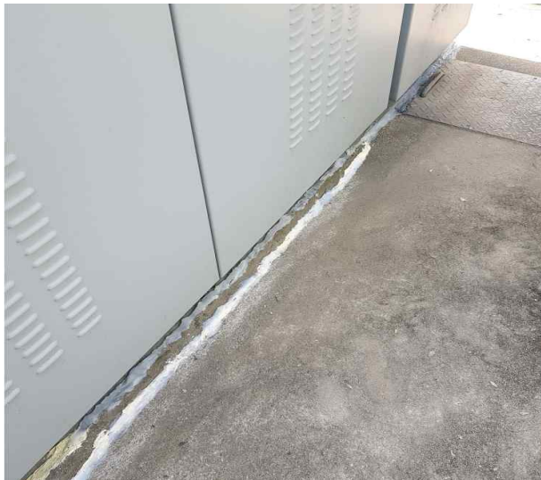
수배전반 전면 부 방수코킹작업