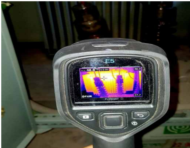
뚝섬벽천분수- 열화상 측정