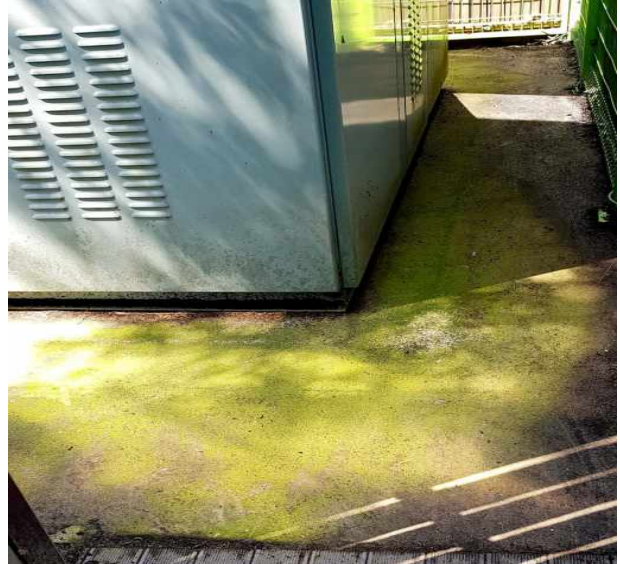
수배전반 주변 청소(나뭇가지 등)