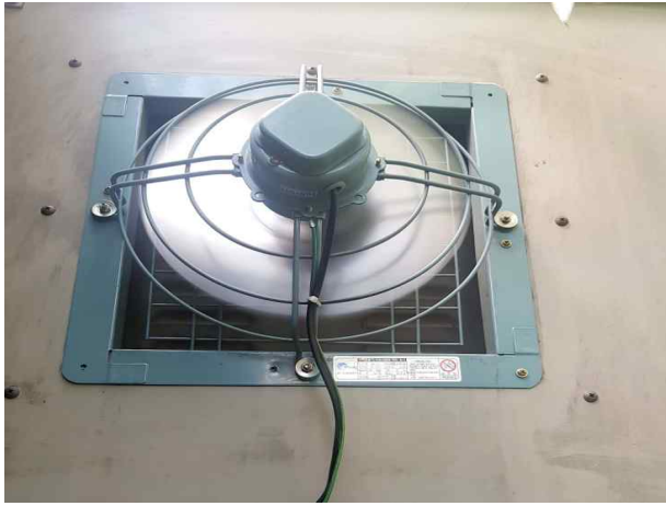
난지거울- 변압기 웬 동작상태 확인