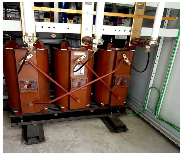
변압기반 내부 상태 확인