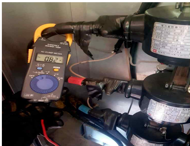
난지물놀이장- 전류 및 CT 상태 확인