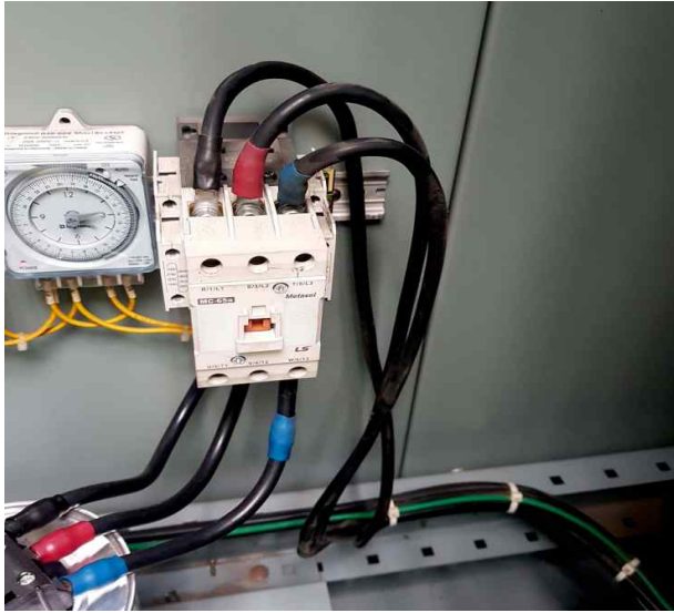
콘덴서 케이블 열화로 케이블타이 해체