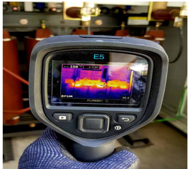
열화상측정 108 (°C)