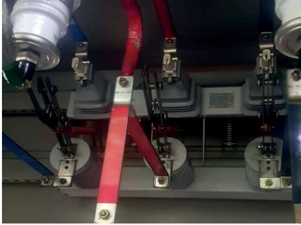
난지거울- AISS OFF 상태 확인후 투입