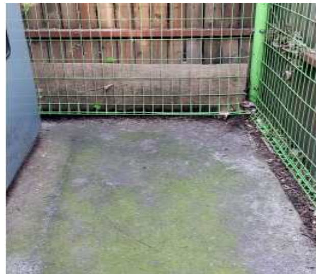
수배전반 주변 청소