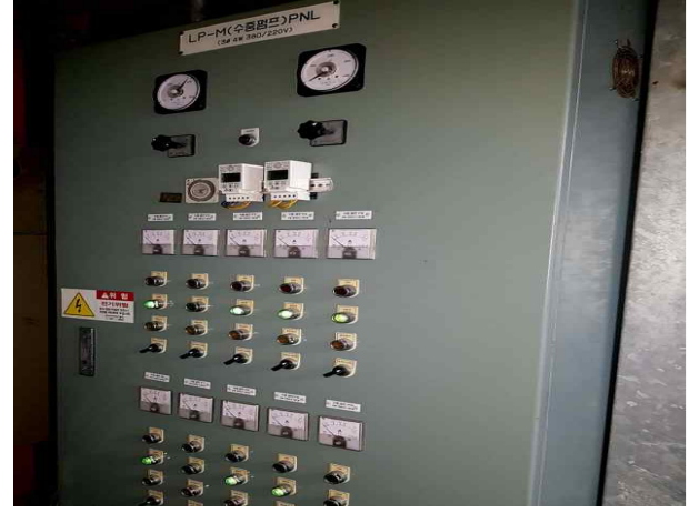
뚝섬벽천분수- LP-M 수중펌프 PNL