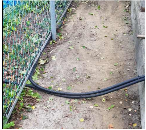
수배전반 주변 잡초제거 완료