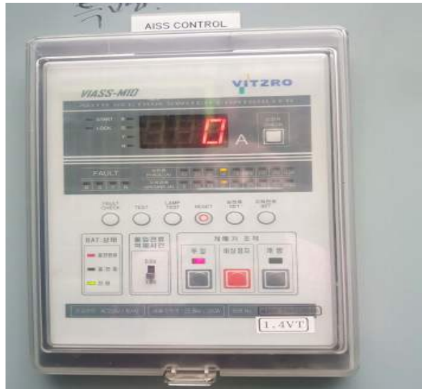
AISS 콘트롤라 BAT 상태 확인