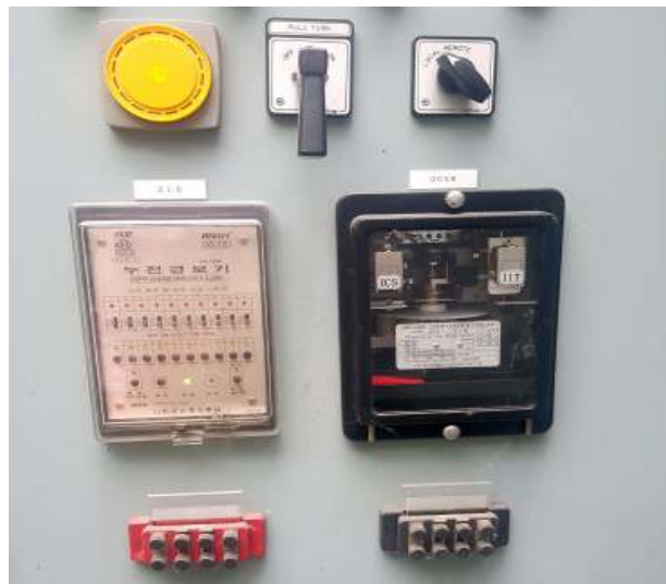
누전경보기 및 계전기 상태 확인