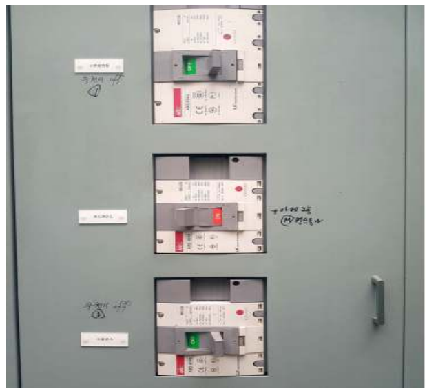
배전반 우천시 OFF MCCB 확인