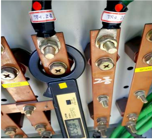
제2종 접지선 누설전류상태 확인