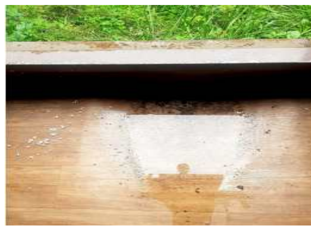
난지물놀이장-출입구 누수 상태 확인