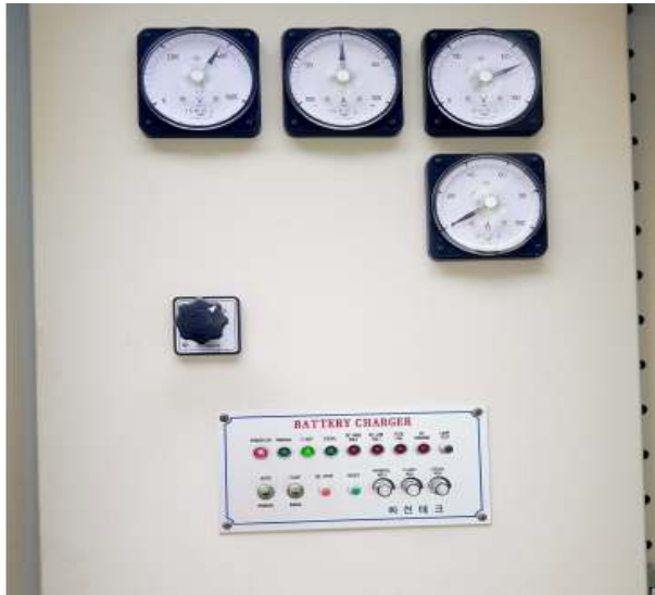
정류기반 전압상태 확인