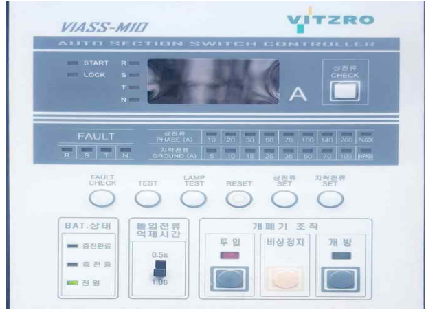
난지거울-AISS 콘트롤라 BAT 방전