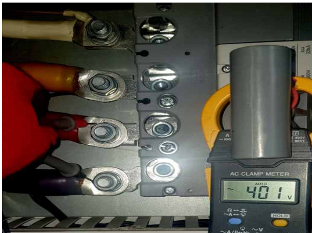
난지물놀이장- 전압 상태 확인