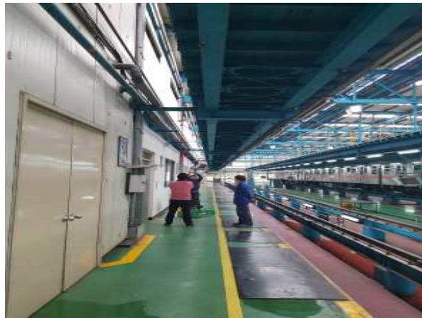
검수고 누수 상태 확인