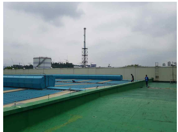
검수고 지붕상태 확인