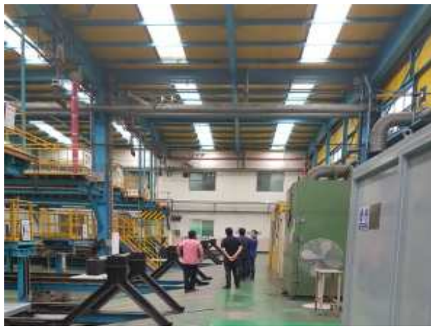
검수고 구조물 상태 확인