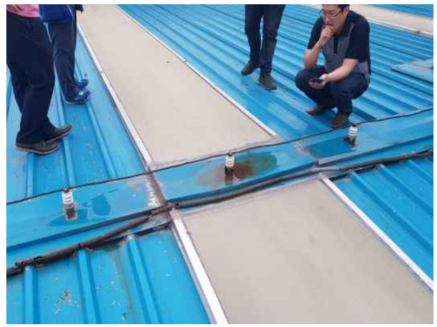
검수고 방수상태 확인