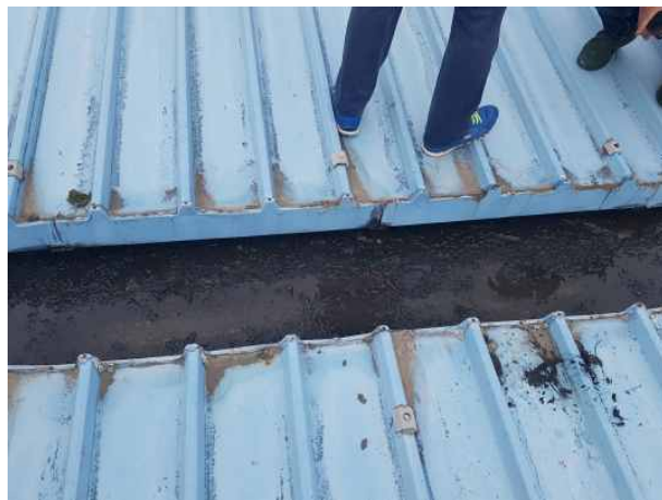
검수고 누수 상태 확인