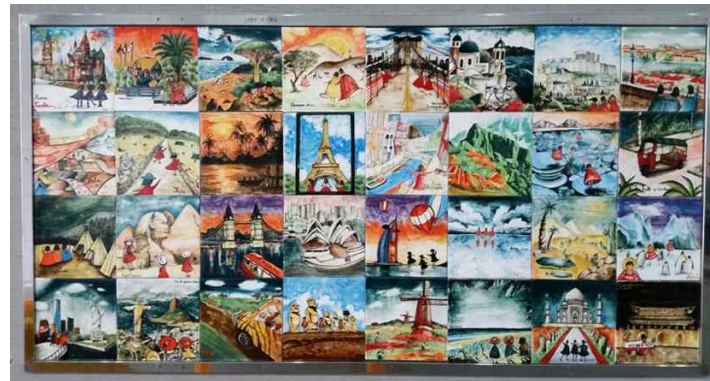
#3. 예시사진 < 주재료: 어린이마을아카데미 안내판(아크릴스카시), 작품사진(전사타일/스텐레스스틸 몰딩) >