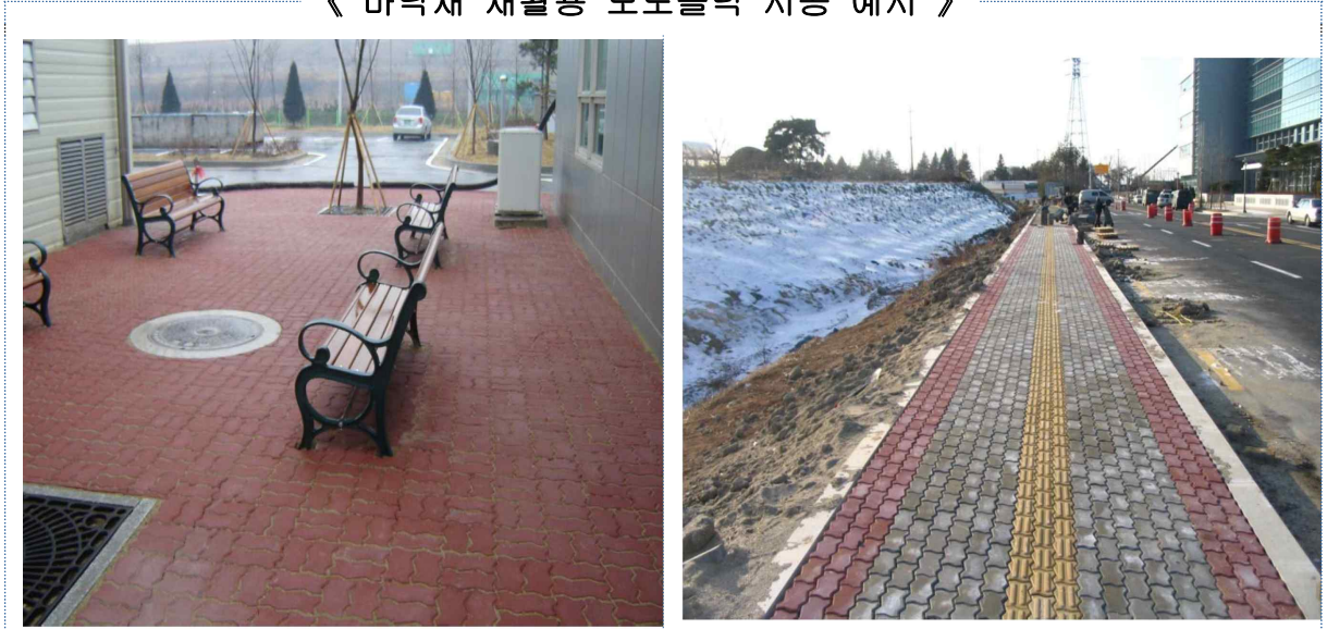
《 바닥재 재활용 보도블럭 시공 예시 》

- 소요량 : U형 312,240장(적색: 100,505, 녹색: 77,305 무색: 134,430장)