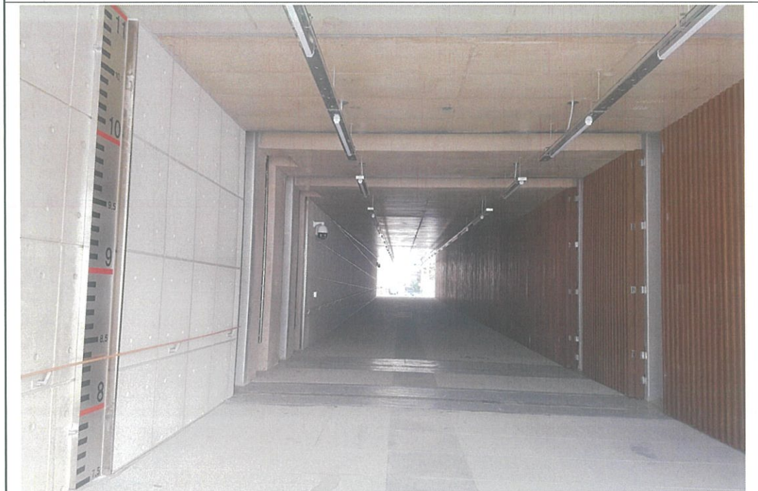
나 들 목 통 로 내 부