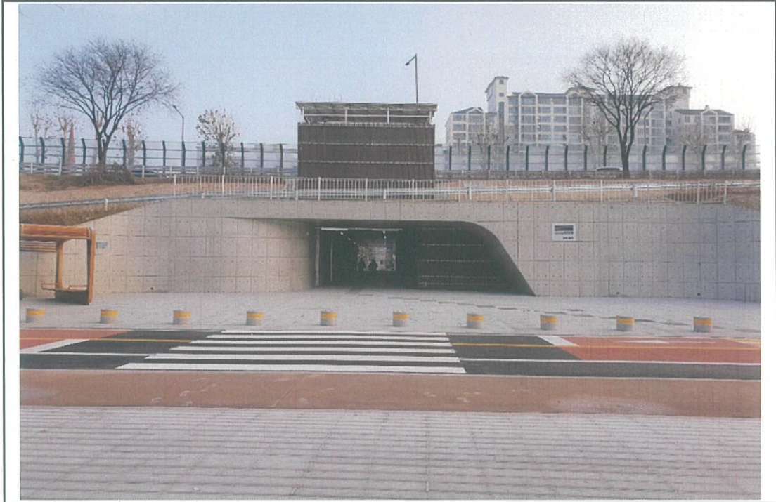
제 외 지 전 경