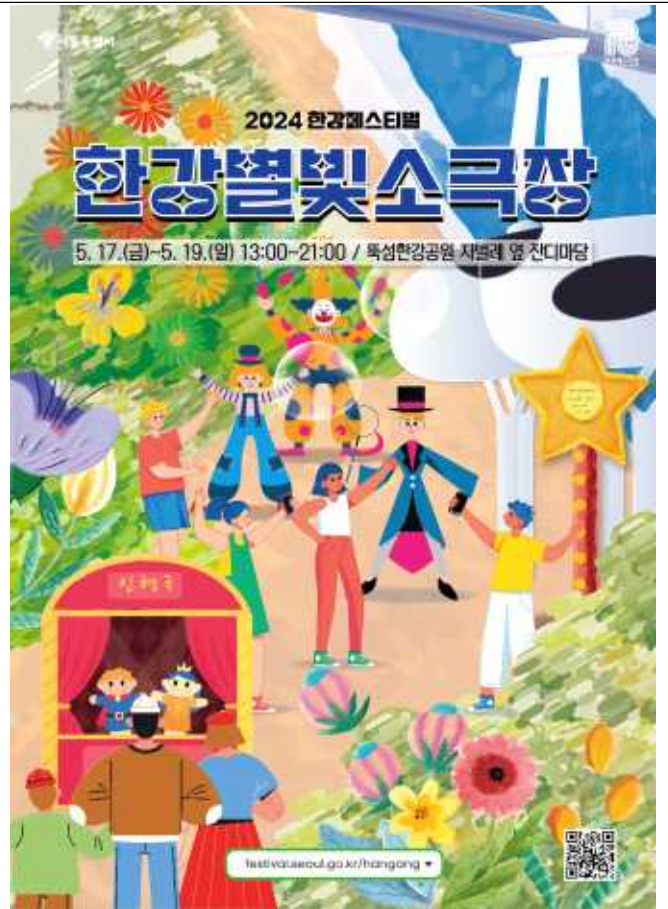
<2024 한강별빛소극장 포스터>