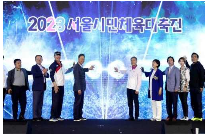
(사진 2) 2023 서울시민 체육대축전 개회식