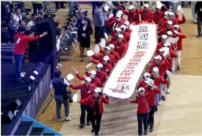
(사진 3) 2023 서울시민 체육대축전 선수입장