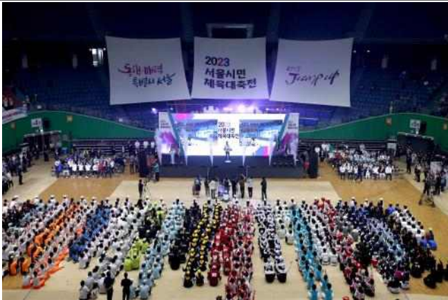
(사진 1) 2023 서울시민 체육대축전 개회식