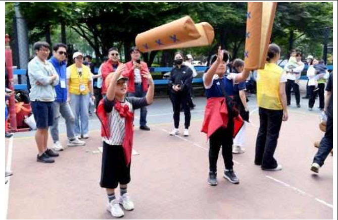
(사진 4) 시민참여종목 '윷놀이'