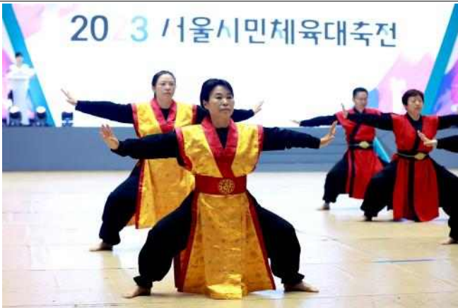
(사진 5) 동호인종목 '국학기공'