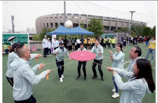
(사진 6) 시민참여종목 '협동 바운스'